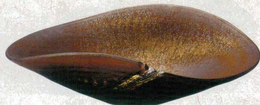
×232-117 金彩たわみ14.0鉢 42.5×36.5×12cm(8入・陶) 33,800円 ×232-127 金彩たわみ12.0鉢 36×27.5×11cm(8入・陶) 12,800円