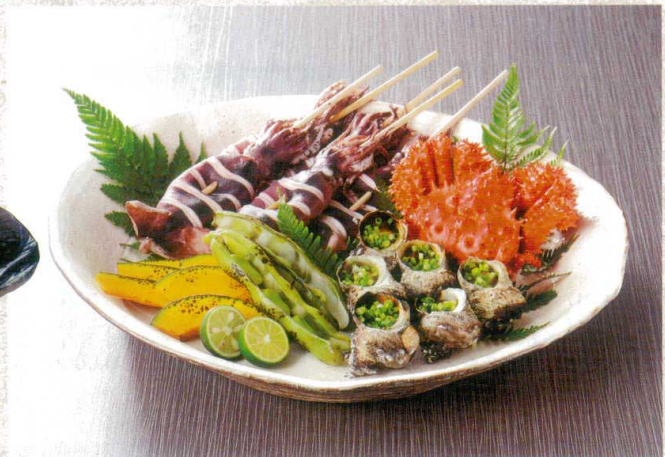
×232-047 荒土しのぎ手13.0大鉢 φ40×6cm(5入・陶) 48,000円 ×232-057 荒土しのぎ手12.0大鉢 φ36×5.5cm(8入・陶) 32,000円