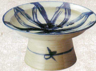
≒232-027 手造りコス模様高台大皿 33.8×15cm(6入・陶) 16,100円