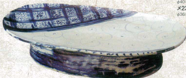
≒232-067 安南七宝渦模様高台楕円盛込皿(手造り) 52×30×10cm(2入・陶) 40,000円