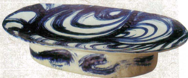
≒232-037 安南刷毛目高台楕円盛込皿(手造り) 52×30×10cm(2入・陶) 40,000円