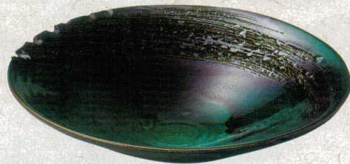
×232-077 緑釉13.7皿鉢 φ41×10cm(8入・陶) 33,800円 ×232-087 緑釉11.0皿鉢 φ35×7cm(8入・陶) 12,600円