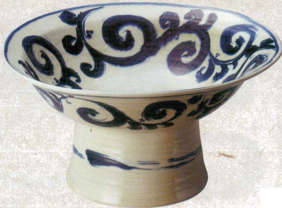
≒232-017 安南唐草特大コンボート(手造り) φ49×24.5cm(1入・陶) 75,000円