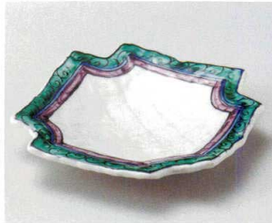
オ027-047 九谷風四つ切皿 18.1×18.1×3.2cm(40入・磁)(美濃焼) 3,000円