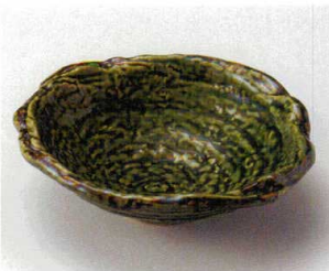
ツ027-077 織部玉潤7.0鉢 21.5×19.5×6cm(30入・陶) 2,800円