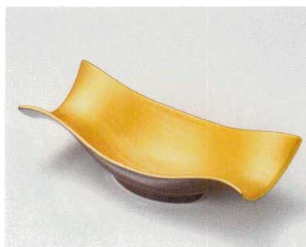
ト027-177 アメ釉くびれ 7寸向付 21.7×9.5×6cm(60入・磁) 2,600円