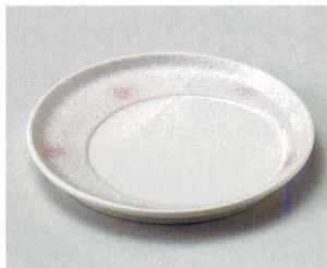
ミ027-167 ピンクボカシラスタースライド皿 φ18.5×2cm(40入・磁) 2,700円