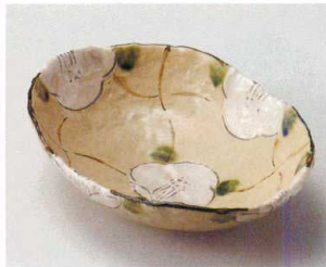
ツ027-127 格子花楕円鉢 21.3×15.3×5.5cm(40入・陶) 2,600円