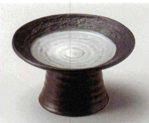
ア027-147 グレース高台向付 φ16.3×9cm(30入・磁) 2,650円