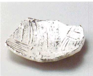
ツ027-157 粉引拭取り変形6.5皿 19.5×19.5×4.7cm(40入・陶) 2,650円