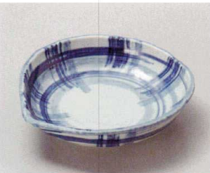
ミ027-107 呉須刷毛格子片口6.5鉢 19.8×19×5.1cm(40入・磁) 2,850円