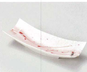
ト027-187 赤一珍菱透し 8寸長皿 24.8×9×5.4cm(60入・磁) 2,600円