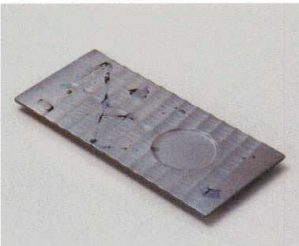
ツ027-117 ラスター一珍 カップ置長角皿 26.5×12.3×1.7cm(40入・磁) 3,200円