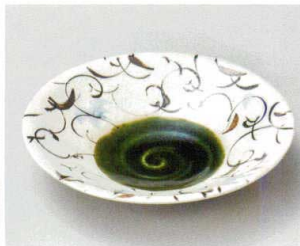
ネ027-087 織部手描き向付 17.5×4.1cm(40入・陶) 2,650円