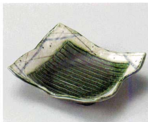
ト027-207 織部筋彫6寸向付 19×16.5×5.2cm(30入・陶) 2,600円