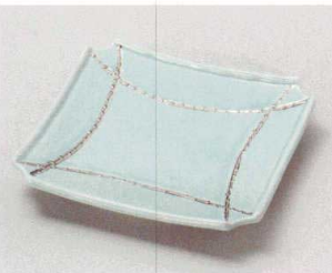
ミ027-067 青白一珍プラチナ正角向付 18.5×18.5×3.2cm(50入・磁) 2,950円