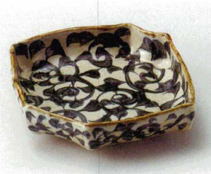
オ027-027 タコ唐草六角変型向付 20.5×17.5×4.8cm(40入・陶) 3,100円