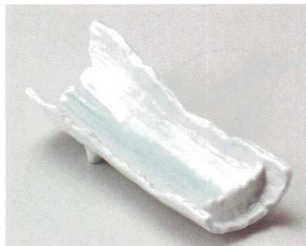
ト027-097 青磁竹割前菜皿 30.8×13×8cm(20入・磁) 2,850円