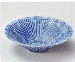
タ027-197 インディゴブルーしのぎ彫6.3向付 φ18.6×5.4cm(40入・磁) 2,500円