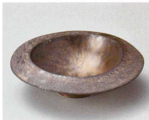
カ027-057 金結晶反型7寸向付 21×20×6.7cm(30入・磁) 3,500円