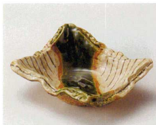
ツ027-137 織部細十草長角60向付 17.2×14.4×6cm(30入・陶) 2,600円