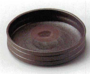
ト027-037 炭化黒切立鉢 φ16.8×4cm(40入・陶) 2,900円