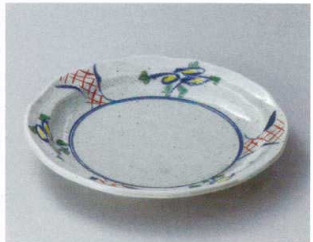
ミ304-027 黄花万暦9.0皿 φ27×3.7cm (20入・磁) 3,550円 ミ304-037 黄花万暦8.0皿 φ25×3.5cm (30入・磁) 3,100円