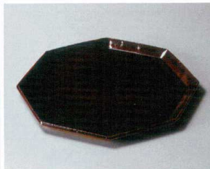
カ304-217 アングルブラウンL 27×27×1.8cm (30入・陶) 6,300円