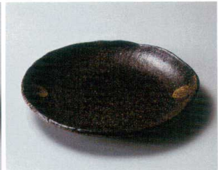
ア304-177 南蛮金彩8.0皿 φ28.8×22.5cm (20入・陶) 3,200円