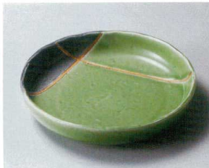
ア304-167 若草金彩22cm浅ボール φ21.8×4.5cm (24入・磁) 3,400円