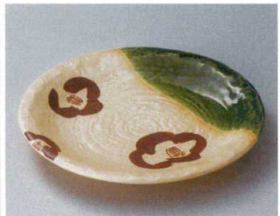
ヤ304-067 織部山茶花パスタ皿 φ27.5×3.5cm (30入・磁) 4,300円 ヤ304-077 織部山茶花7.0皿 φ22.5×3cm (40入・磁) 1,650円