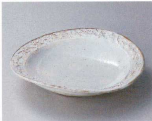
ト304-107 粉引 石目楕円盛皿 28×26.3×6.3cm (15入・陶) 5,100円