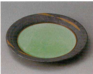
ミ304-047 金カスリ9.0盛皿 φ27.8×3.4cm (20入・磁) 4,100円 ミ304-057 金カスリ7.5皿 φ23.5×3cm (30入・磁) 3,150円