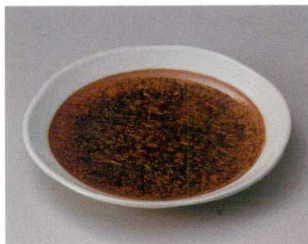
イ304-137 金化粧 8.0皿 φ25×3.8cm (20入・陶) 3,600円 イ304-147 金化粧 7.0皿 φ22×3.5cm (30入・陶) 2,400円