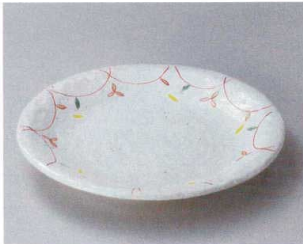
ミ304-117 粉引小花90パスタ皿 φ27.5×3.5cm (20入・磁) 4,050円