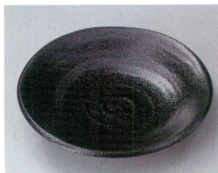
ア304-187 ヴォルテックス24.5cm深皿 φ24.4×5cm (24入・磁) 780円 ア304-197 ヴォルテックス21.5cm深皿 φ21.5×4cm (40入・磁) 520円