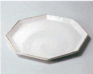
カ304-017 アングルホワイトL 27×27×1.8cm (30入・陶) 6,300円