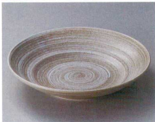
イ304-087 草月9.5盛皿 φ28.8×6.1cm (16入・磁) 2,150円 イ304-097 草月7.5麵皿 φ23×5cm (30入・磁) 880円