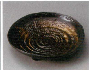
ト304-227 黒金三ッ足 八寸皿 φ23.5×4.5cm (20入・陶) 3,000円