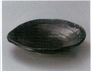
ト304-127 石目黒めん皿 φ28×6cm (15入・磁) 3,800円