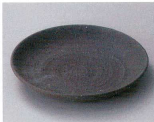
ト304-157 黒土8寸皿 φ25.5×3.5cm (12入・陶) 3,400円