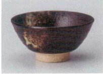
ア358-027 手造りわびすけ大平 φ12.3×6.2cm(80入・陶) 1,450円 ア358-037 手造りわびすけ中平 φ11.3×5.3cm(100入・陶) 1,400円