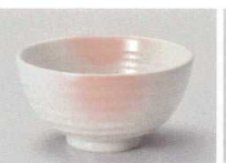
タ358-617 ソギ新彩ボタ飯碗大 φ12.5×6.5cm(60入・磁) 700円 タ358-627 ソギ新彩ボタ飯碗小 φ11.5×6.3cm(80入・磁) 560円