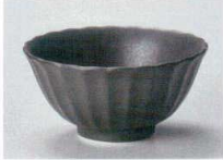
ケ358-147 かすみ 黒 11.5cmポウル φ11.5×5.5cm(磁) 900円