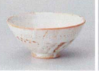
ト358-177 水草志野大平茶碗 φ13×6.7cm(60入・陶) 1,150円 ト358-187 水草志野中平茶碗 φ12×5.5cm(80入・陶) 1,050円