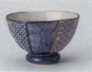
ア358-107 祥瑞かるかる茶碗大 φ10.8×6.7cm(100入・陶) 1,300円 ア358-117 祥瑞かるかる茶碗小 φ10.2×6cm(100入・陶) 1,300円