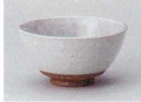
イ358-127 吹志野茶碗(大) φ12.4×6.4cm(80入・陶) 1,300円 イ358-137 吹志野茶碗(小) φ11×5.7cm(100入・陶) 1,300円