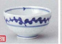
ツ358-197 唐草飯碗(大) φ11×6cm(100入・強) 1,200円 ツ358-207 唐草飯碗(小) φ10.2×5.6cm(120入・強) 1,050円