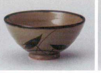
ミ358-317 益子水草大平 φ12.8×6.3cm(100入・陶) 1,050円 ミ358-327 益子水草中平 φ11.6×5.8cm(120入・陶) 850円