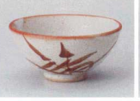
ミ358-297 新志野あし大平 φ12.5×6.1cm(100入・陶) 1,050円 ミ358-307 新志野あし中平 φ11.8×5.6cm(120入・陶) 850円