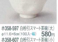
ホ358-597 白粉引スマート茶碗(大) φ11.6×6cm(100入・磁) 580円 ホ358-607 白粉引スマート茶碗(小) φ10.5×5.2cm(120入・磁) 520円