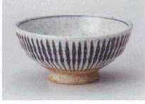
ロ358-257 細十草灰大平 φ13×5.7cm(80入・陶) 1,080円 ロ358-267 細十草灰中平 φ11.5×5.2cm(120入・陶) 1,020円