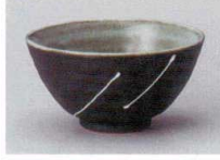
イ358-237 黒備前白ライン茶碗 大 φ12.4×6.4cm(100入・陶) 1,100円 イ358-247 黒備前白ライン茶碗 小 φ11.4×5.8cm(120入・陶) 1,000円