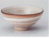
ト358-337 赤志野大平 φ12.5×5.5cm(80入・陶) 920円 ト358-347 赤志野中平 φ12×5.3cm(100入・陶) 800円