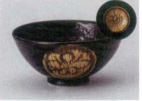
ミ358-157 引出天目松竹梅大平 φ12.5×6cm(100入・陶) 1,280円 ミ358-167 引出天目松竹梅中平 φ11.8×5.5cm(120入・陶) 1,150円