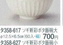
タ358-617 ソギ新彩ボタ飯碗大 φ12.5×6.5cm(60入・磁) 700円 タ358-627 ソギ新彩ボタ飯碗小 φ11.5×6.3cm(80入・磁) 560円