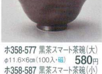
ホ358-577 黒茶スマート茶碗(大) φ11.6×6cm(100入・磁) 580円 ホ358-587 黒茶スマート茶碗(小) φ10.5×5.2cm(120入・磁) 520円