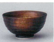
ハ358-647 志野サビ刷毛飯碗大 φ11.7×6.2cm(120入・磁) 460円 ハ358-657 志野サビ刷毛飯碗小 φ10.5×6.3cm(120入・磁) 440円