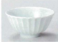
ケ358-017 かすみ 青白 11.5cmポウル φ11.5×5.5cm(磁) 900円

突出皿 長角皿 さんま皿 焼物皿 仕切皿 楕長皿 長角大皿 菱形大皿 丸大皿 角大皿 角中皿 楕円皿 菱形中皿 丸中皿 フルーツ皿 長角大皿 大鉢 盛鉢 ボール 焼酎 サーバー ロックカップ フリーカップ 酒器 箸置 卓上小物 そば小物 薬味皿 お灸(灸)器 加一皿 多用丼 小鉢 そば鉢 福井・量鉢 飯器・飯碗 寿司酒呑 湯呑 煎茶・玉湯呑 抹茶碗 ボウル 魚須・土瓶 備前焼 有田焼・波佐見焼 土器・磁器 すり鉢