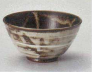
イ358-217 白刷毛目茶碗(大) φ12.3×6.2cm(80入・陶) 1,100円 イ358-227 白刷毛目茶碗(小) φ11.2×5.7cm(100入・陶) 1,050円