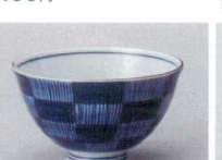
ホ358-767 市松毛料 φ14.2×6.5cm(80入・磁) 650円 ホ358-777 市松(軽量)大平 φ12×7cm(120入・磁) 780円 ホ358-787 市松中平 φ11×6cm(120入・磁) 460円