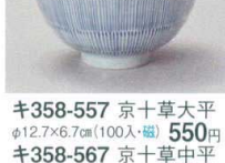
キ358-557 京十草大平 φ12.7×6.7cm(100入・磁) 550円 キ358-567 京十草中平 φ11.2×5.5cm(120入・磁) 420円