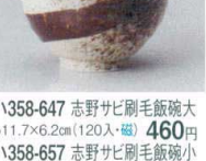
ハ358-647 志野サビ刷毛飯碗大 φ11.7×6.2cm(120入・磁) 460円 ハ358-657 志野サビ刷毛飯碗小 φ10.5×6.3cm(120入・磁) 440円