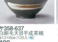
ヤ358-637 白刷毛天目平成茶碗 φ12×6cm(120入・磁) 400円