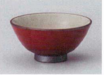
ア358-047 手造り雅大平 φ12.3×6.2cm(80入・陶) 1,450円 ア358-057 手造り雅中平 φ11.3×5.5cm(100入・陶) 1,400円