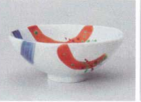
ミ358-067 錦朱呉須刷毛平茶碗(大) 13.2×12.7×5.3cm(120入・磁) 1,550円 ミ358-077 錦朱呉須刷毛平茶碗(小) 12×11.2×4.5cm(120入・磁) 1,450円