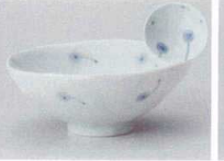
ミ358-087 ボンボン・棉花平茶碗(大) 13.2×13×5.5cm(120入・磁) 1,450円 ミ358-097 ボンボン・棉花平茶碗(小) 12×11.5×5cm(120入・磁) 1,350円