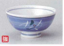
ロ358-277 彫唐草毛料 φ13.5×6.4cm(60入・強) 1,060円 ロ358-287 彫唐草中平 φ11.5×5.9cm(120入・強) 780円