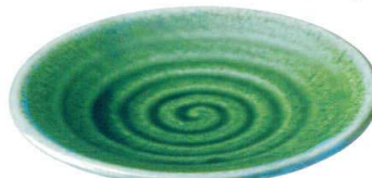
ミ429-217 丸8.0皿 25.3cm(30入・強) 3,050円