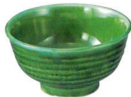
ミ429-027 5.5深口丼 17×9cm(30入・強) 2,000円