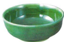
ミ429-017 6.8ラーメン丼 20×7.8cm(30入・強) 3,000円