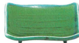
ミ429-347 まな板正角焼物 17.5×4cm(30入・強) 2,050円