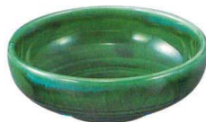
ミ429-077 6.3ボール 19.5×7cm(30入・強) 2,700円