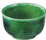
ミ429-037 5.0多用鉢 14.7×8.7cm(40入・強) 2,000円