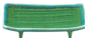
ミ429-337 まな板焼物皿 21.5×15×3.5cm(30入・強) 2,050円