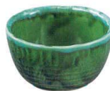
ミ429-117 花形4.0小鉢 12.3×6.8cm(60入・強) 1,200円