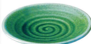
ミ429-207 丸7.0皿 22cm(40入・強) 1,850円