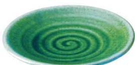
ミ429-197 丸6.0皿 19.5cm(60入・強) 1,200円