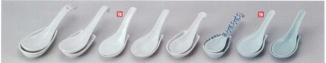
□682-297 丸型ラーメンレンゲ(大) 19×5.2×4cm(240入・磁) 550円 □682-317 ラーメンレンゲ 17.5×5.2×3.7cm(240入・磁) 410円 □682-337 白強化レンゲ 14.4cm(50×12入・強) 390円 □682-357 白上レンゲ 14×4.5×4.6cm(50×12入・強) 240円 □682-377 白並レンゲ 13cm(50×12入・磁) 170円 ♪682-397 タコ唐草レンゲ φ15.5×4cm(100入・磁) 1,150円 ♪682-417 青白磁レンゲ φ14.3×4.5cm(300入・強) 800円 □682-437 青磁上レンゲ(新) 14cm(50×12入・磁) 310円 □682-307 丸型ラーメン受台(大) 10.8×5.9×2.5cm(300入・磁) 280円 □682-327 ラーメンレンゲ受台 10.8×6.5×2.6cm(240入・磁) 340円 □682-347 白強化レンゲ台 9.1×5.5cm(300入・強) 340円 □682-367 白上レンゲ台 9×5.7cm(300入・磁) 340円 □682-387 白並レンゲ台 8.5×5.5cm(300入・磁) 220円 ♪682-407 タコ唐草レンゲ台 8×5.4×2.5cm(100入・磁) 900円 ♪682-427 青白磁レンゲ台 9×5.7×2.3cm(300入・磁) 600円 □682-447 青磁上レンゲ台(新) 5.7×9cm(30×12入・陶) 360円