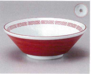
ト682-107 赤巻鳳凰切立6.3井 φ19.6×7.1cm(50入・磁) 1,150円