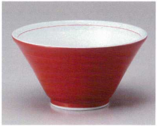
Ya682-037 朱巻切立6.3深井 φ18.8×10.2cm(30入・磁) 1,250円 Ya682-047 朱巻切立5.5深井 φ16.6×8.6cm(40入・磁) 950円