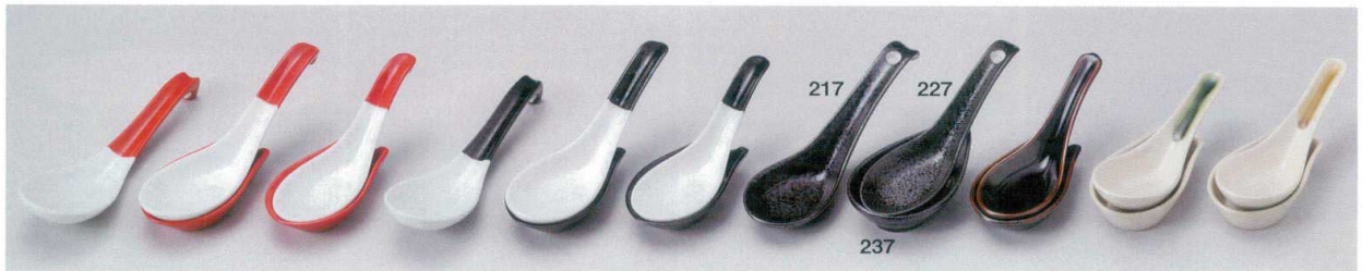
ミ682-117 赤ラーメンレンゲ 17.6×5.2cm(180入・磁) 510円 ミ682-147 赤カギレンゲ(S) 17.6×5.2cm(180入・磁) 340円 ミ682-167 黒ラーメンレンゲ 17.6×5.2cm(180入・磁) 510円 ミ682-197 黒カギレンゲ(S) 17.6×5.2cm(180入・磁) 340円 ホ682-217 黒反レンゲ 15×4.8cm(180入・磁) 400円 □682-247 天目上レンゲ 14.2cm(400入・磁) 360円 □682-267 織部ラインレンゲ 14×4.8×5.5cm(40×12入・陶) 340円 □682-287 青瀬戸ラインレンゲ 14×4.8×5.5cm(40×12入・陶) 340円 ミ682-127 赤カギレンゲ(L) 15.6×5.5cm(200入・磁) 390円 ミ682-157 赤受台 9.4×5.6×2.2cm(200入・磁) 420円 ミ682-177 黒カギレンゲ(L) 15.6×5.5cm(200入・磁) 390円 ミ682-207 黒受台 9.4×5.6×2.2cm(200入・磁) 380円 □682-227 黒結晶反レンゲ(大) 16×4.7×5.7cm(300入・陶) 780円 □682-257 天目レンゲ台 9.2×5.4×2cm(30×12入・陶) 470円 □682-277 白レンゲ台 8.7×5.4cm(30×12入・陶) 300円 □682-277 白レンゲ台 8.7×5.4cm(30×12入・陶) 300円