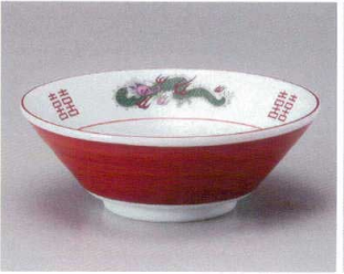
ト682-097 赤巻三ツ竜切立6.3井 φ19.6×7.1cm(50入・磁) 1,200円