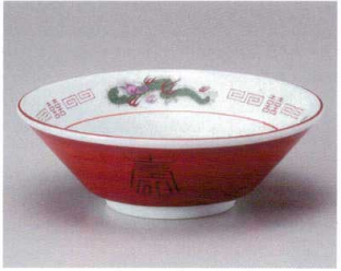
ト682-087 赤巻三ツ竜切立6.8井 φ21.5×7.5cm(24入・磁) 1,550円