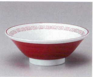
Ya682-067 赤巻鳳凰6.8切立井 20.3×7.4cm(40入・磁) 1,250円