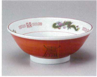
Ya682-077 赤巻三ツ竜6.8高台井 φ21.4×8.6cm(40入・磁) 1,200円