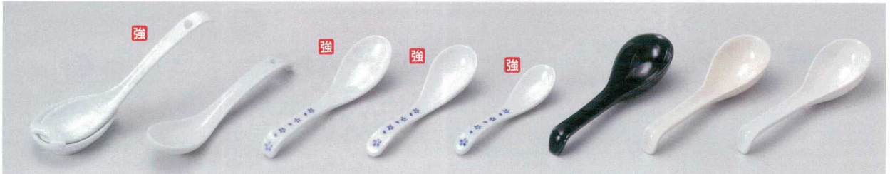
□682-457 白6.0反レンゲ 18×4.3×3.4cm(200入・強) 810円 □682-477 中型ラーメンレンゲ 18.2×4.4×3.1cm(240入・磁) 470円 □682-487 小町ブルー手平レンゲ 16.5×4.4cm(200入・強) 980円 □682-497 小町ブルー手平反レンゲ(大) 15×4.4cm(300入・強) 740円 □682-507 小町ブルー手平反レンゲ(小) 12.7×3.2cm(300入・強) 740円 □682-517 引掛けレンゲ(黒) φ5×16.7×2.7cm(100入・磁) 300円 □682-527 引掛けレンゲ(ロマンズ) φ5×16.7×2.7cm(100入・磁) 300円 □682-537 引掛けレンゲ(白) φ5×16.7×2.7cm(100入・陶) 300円