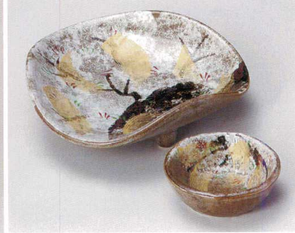
ト007-117 唐津瑠璃木5.5皿 16.5×15.5×5.2cm (60入・陶) 4,150円 ト007-127 唐津瑠璃木千代口 φ8×2.7cm (160入・陶) 1,450円