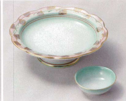
タ007-097 二色吹武蔵野高台向付 φ17.5×5cm (30入・磁) (有田焼) 4,290円 タ007-107 二色吹武蔵野千代口 φ7.5×2.5cm (180入・磁) (有田焼) 1,430円