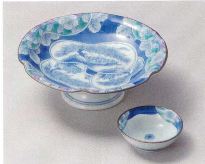
タ007-077 染錦三ツ重瓢子山水絵向付 φ17.5×6cm (30入・磁) (有田焼) 4,290円 タ007-087 染錦三ツ重瓢子山水絵千代口 φ7.5×2.5cm (180入・磁) (有田焼) 1,760円