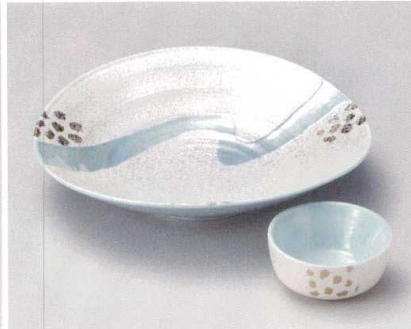
ト007-037 パールラスター流水 向付 18.5×17.8×4.5cm (60入・磁) 2,850円 ト007-047 パールラスター流水 千代口 φ6.5×3cm (200入・磁) 970円