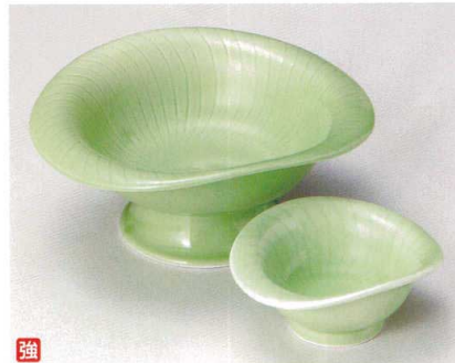
ア007-137 ヒワ高台刺身鉢 18.3×16.3×8cm (30入・磁) 4,500円 ア007-147 ヒワ高台千代口 10.9×9.2×4.9cm (120入・磁) 1,080円