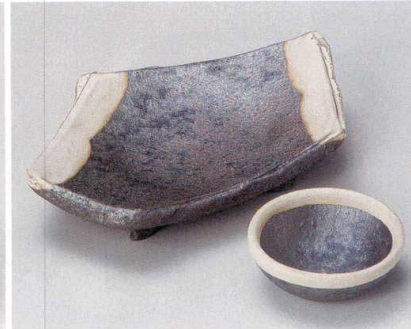
×007-157 黒窯変掛け分け変型足付皿 21×13.5×3cm (40入・陶) 4,280円 ×007-167 黒窯変掛け分け千代口 φ7.8×3cm (100入・陶) 810円