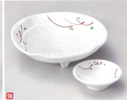
ネ007-237 赤武蔵野 平向付 17.5×5.5cm (40入・磁) 2,750円 ネ007-247 赤武蔵野 平千代口 8.5×3cm (100入・磁) 910円