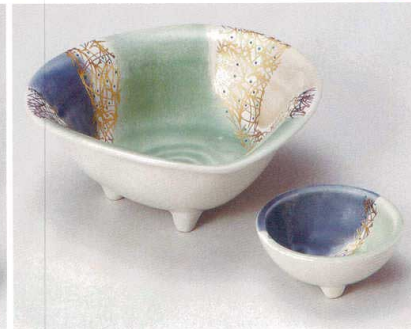
ト007-217 三色金松葉刺身鉢 15.8×15×6.2cm (50入・磁) 3,800円 ト007-227 三色金松葉千代口 φ7.3×3.2cm (200入・磁) 1,500円