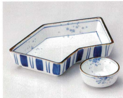
ミ007-197 染付太唐草のし形切立向付 φ20×11×6cm (40入・磁) 2,800円 ミ007-207 染付吹墨 丸千代口 φ6.7×3.2cm (150入・磁) 850円