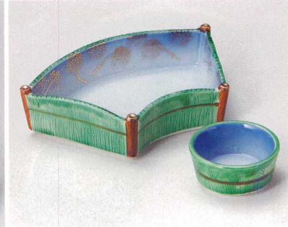
ミ007-177 柴垣扇向付 18.3×12×4.5cm (40入・磁) 4,050円 ミ007-187 柴垣丸千代口 φ6.8×3.2cm (150入・磁) 1,500円