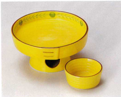
ミ007-017 三方型高台刺身鉢 φ14.3×7cm (30入・磁) 4,750円 ミ007-027 三方型丸千代口 φ7×3.4cm (150入・磁) 1,750円

刺身鉢・千代口 向付 中鉢 小鉢 小付 珍味 松花堂 蓋向 円菓子碗 むし碗 天皿・どんすい