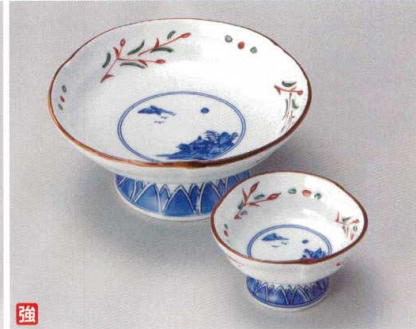
カ007-057 赤絵京山水刺身 φ15×7cm (30入・磁) 4,200円 カ007-067 赤絵京山水千代口 φ8.5×5cm (100入・磁) 1,600円