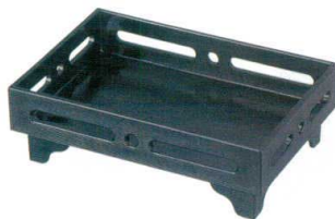
E716-167 [A]7.5寸長手足付透かし盛器 黒 22.4×15×7.4cm(60入) 2,650円