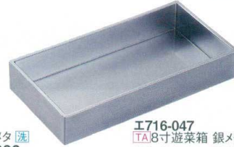
E716-047 [TA]8寸遊菜箱 銀メタ 漆 24.4×12.6×4.5cm(50入) 3,100円