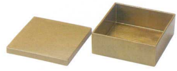
E716-147 [A]4寸白鷹角重 蓋 金内金塗 12.3×12.3×1.5cm(200入) 1,000円