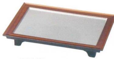
E716-177 [A]8.5寸長手足付懷石プレート 白檀内銀透き底黒塗 25.8×18.6×3cm(80入) 3,300円