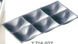
E716-027 [TA]23cmシックスコンボプレート 銀メタ 漆 23.2×11.3×2.9cm(100入) 2,000円