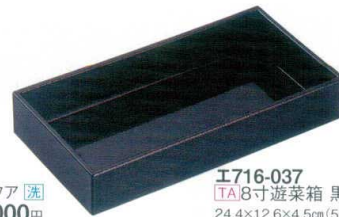
E716-037 [TA]8寸遊菜箱 黒ヘギ目 漆 24.4×12.6×4.5cm(50入) 2,100円