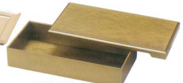
E716-097 [A]8.5寸白鷹長手重 蓋 金内金塗 25.5×13.3×1.9cm(100入) 1,400円