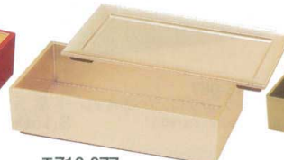
E716-077 [A]7.5寸長手弁当用 前菜皿 金煌塗 21.8×11.5×1cm(200入) 1,800円