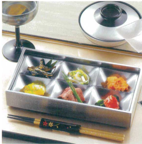
E716-017 [TA]23cmシックスコンボプレート 白アーク 漆 23.2×11.3×2.9cm(100入) 2,000円