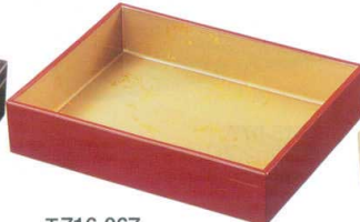
E716-067 [A](大)長角盛箱 朱内色紙金箔 [S・H]塗 21.2×16.7×4.6cm(50入) 3,000円