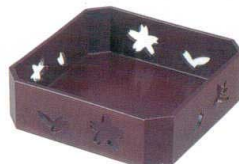
E716-127 [A]隅切透かし盛器 溜 18.2×18.2×5.8cm(60入) 2,250円