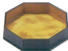
E716-137 [A]八角盛器 金雲流洩黒 21.8×20.2×4.6cm(60入) 2,850円