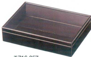
E716-057 [A](小)長角盛箱 溜 20×14.8×5cm(60入) 2,050円