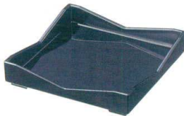
E716-117 [A]6寸角太閤皿 黒(全面塗) 18.2×18.2×3.8cm(80入) 2,000円