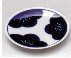
239-8-206 染付梅縁起紋小皿 800円 12.3×1.8cm 26506205