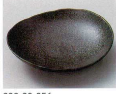
239-20-056 黒備前楕円皿 410円 13.2×12×3.6cm 120入 26116051