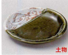
239-11-716 織部ライン丸銘々皿 720円 13×1.7cm 28216783