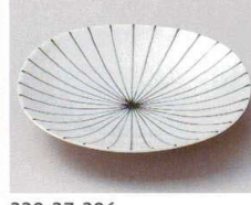
239-27-206 十草四方3.5取皿 300円 13×12.6×2.1cm 24628204