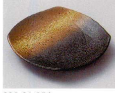
239-21-056 黒備前吹4.0銘々皿 400円 12.5×12.5×2.3cm 26115051