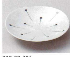
239-29-206 花火四方3.5取皿 300円 13×12.6×2.1cm 24629204