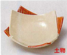
239-1-716 赤絵重ね皿(小) 1,660円 11×11×3.6cm 25809711