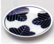
239-6-206 染付松縁起紋小皿 800円 12.3×1.8cm 26508205