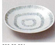
239-28-206 たんぼぼ四方3.5取皿 300円 13×12.6×2.1cm 24630204