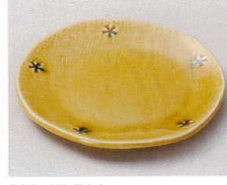
239-17-716 黄瀬戸印花銘々皿 620円 13×1.5cm 25922781