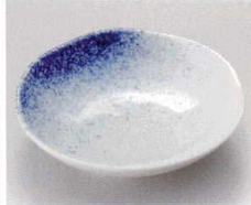
239-3-366 吹墨波瀾4.0皿 840円 12.2×2.7cm 26504365