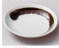
239-18-256 白茶刷毛取皿 490円 12.8×2.5cm 28723253