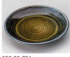
239-25-756 青風丸4寸皿 340円 13.2×2cm 26526755