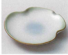
239-15-716 若草ひさご銘々皿 500円 13×12.5×2.5cm 52612711