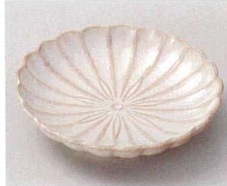
239-2-116 窯変彩釉菊型銘々皿 880円 13.3×3cm 28621112