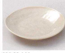
239-22-146 ページュそぎ楕円4.0皿 360円 13.5×12.5×2.5cm 24524144