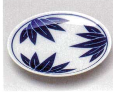
239-7-206 染付竹縁起紋小皿 800円 12.3×1.8cm 26507205