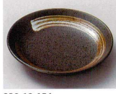
239-19-156 備前風白刷毛4.0深皿 420円 12.9×2.5cm 28119153