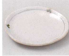
239-12-716 みつば4.0丸皿 720円 13×1.7cm 24111714