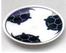
239-10-656 えんぎ紋 亀小皿 800円 12.2×1.5cm 26509655