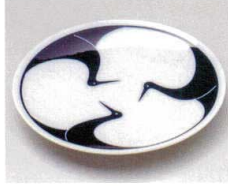
239-9-656 えんぎ紋 鶴小皿 800円 12.2×1.5cm 26510655