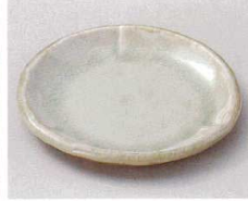
239-13-716 白雲4.0丸皿 700円 13×1.7cm 25915711