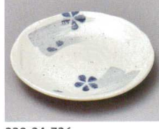
239-24-726 桜の舞4.0丸皿 350円 13.1×2cm 23924726