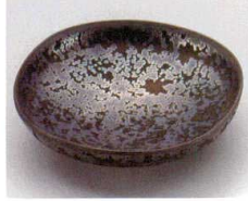
239-14-206 金結晶12cm撫角深皿 680円 12.6×12.2×3.4cm 26517205