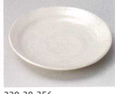
239-30-356 クラフト粉引4.0皿 240円 13.2×2.3cm 26122355