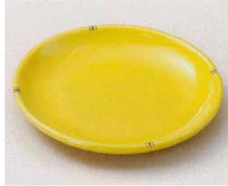
239-4-716 黄釉二彩4.5丸皿 800円 13.4×1.6cm 24513714