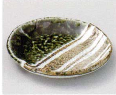
239-5-716 織部ストライプ丸銘々皿 780円 13.3×1.8cm 26012701