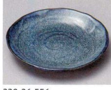
239-26-556 群青4.0皿 320円 13.2×2cm 23926556