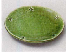
239-16-716 織部印花銘々皿 620円 13×1.5cm 25921781