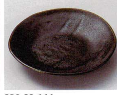
239-23-146 黒そぎ楕円4.0皿 360円 13.5×12.5×2.5cm 24725144