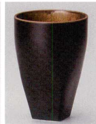
299-17-526 金結晶フリーカップ(黒) 1,200円 8×11.2cm(290cc) 33224525