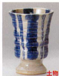
299-9-216 太十草高台カップ(小) 840円 7.5×10.2cm(180cc) 34914213