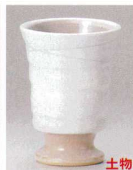
299-10-216 白釉線彫高台カップ(小) 840円 7.5×10.2cm(180cc) 34913213