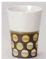
299-27-676 虹色水玉タンブラー白 1,350円 7.8×11cm 10入 33212675