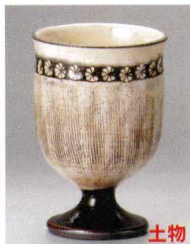
299-2-116 三島ワインカップ 3,000円 8×11.5cm(250cc) 10入 35402112