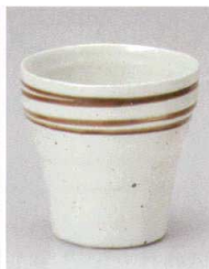
299-20-216 白釉ラインフリーカップ 750円 9.9×10cm(400cc) 35221621