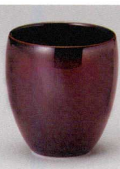
299-25-356 うるしプラウウめ酒コブレット 1,970円 9.4×9.9cm(380cc) 35205353