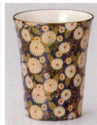
299-23-526 菊の小路フリーカップ(紺) 1,380円 8.5×10.6cm(330cc) 33217525