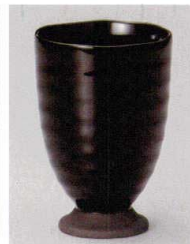
299-4-526 黒釉高台フリーカップ 1,100円 7.5×11cm(250cc) 33207525