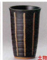
299-30-286 赤鉄フリーカップ(大) 1,200円 8.5×12cm(350cc) 10入 34601281