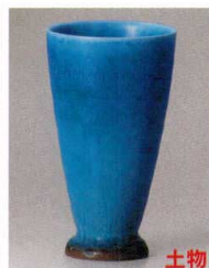
299-28-206 トルコマットカップ(大) 2,600円 8×14cm(320cc) 10×8入 34405201