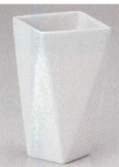
299-19-626 折り紙フリーカップ 2,420円 7.7×13.3cm(400cc) 34801621