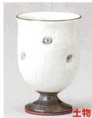
299-3-116 粉引印花ワインカップ 3,000円 8×11.5cm(250cc) 10入 32805114