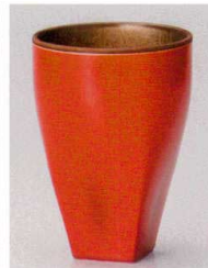
299-16-526 金結晶フリーカップ(赤) 1,200円 8×11.2cm(290cc) 33225525