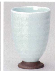
299-6-526 青磁高台フリーカップ 1,050円 7.5×11cm(250cc) 33301525