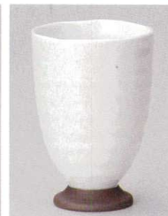
299-5-526 白磁高台フリーカップ 1,000円 7.5×11cm(250cc) 33302525