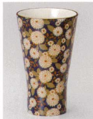
299-14-526 菊の小路トルカップ(紺) 1,650円 7.6×12.5cm(300cc) 33208525