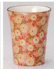
299-24-526 菊の小路フリーカップ(ピンク) 1,380円 8.5×10.6cm(330cc) 33216525