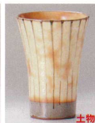
299-11-116 粉引十草フリーカップ 2,300円 8.8×12.5cm(300cc) 10入 34413111