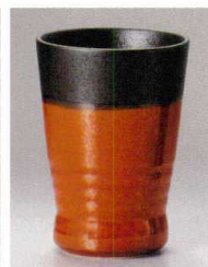
299-29-206 トルコマットカップ(小) 2,250円 7.8×12.4cm(200cc) 10×8入 34406201