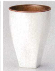
299-18-526 金結晶フリーカップ(白) 1,200円 8×11.2cm(290cc) 33223525