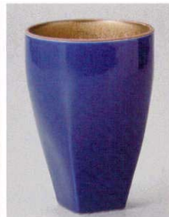
299-15-526 金結晶フリーカップ(青) 1,200円 8×11.2cm(290cc) 29915526