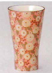
299-13-526 菊の小路トルカップ(ピンク) 1,650円 7.6×12.5cm(300cc) 33209525