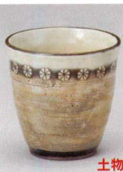
299-1-116 三島フリーカップ 3,000円 9.8×10cm(360cc) 10入 35401112