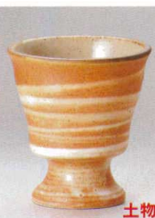
299-7-216 白刷毛高台カップ 1,000円 9×10cm(230cc) 34910213