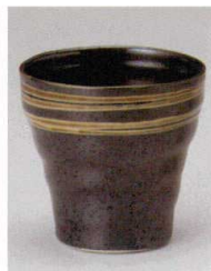
299-21-216 黒釉ラインフリーカップ 750円 9.9×10cm(400cc) 35222121