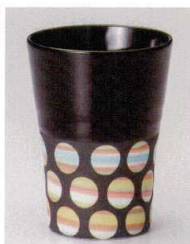
299-26-676 虹色水玉タンブラー黒 1,350円 7.8×11cm 10入 33213675