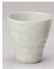
299-22-206 いこい焼耐カップ 660円 9.5×10cm(390cc) 35507203