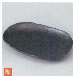
151-205-791 400円 黒釉6.0小判皿 (18×12.5×1.5) 1014750479