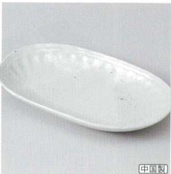
151-402-521 430円 粉引小判皿 (19.6×11.6×2.6) 1014750352