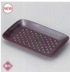
151-404-741 1,040円 鉄鈔エンボス長角皿 (17×10.8×2.5) 1115140474