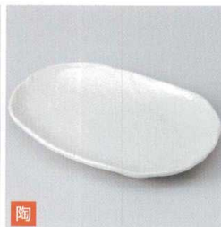
151-204-791 400円 白釉6.0小判皿 (18×12.5×1.5) 1014750579