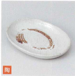
151-302-601 460円 粉引刷毛豆大皿 (13.7×10.2×1.8) 518140560