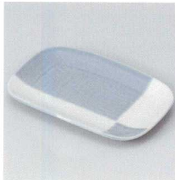
151-201-471 880円 市松長角皿(ブルー) (17.5×18) 914540147