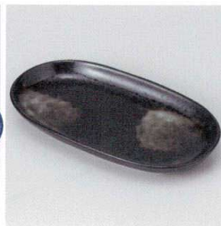
151-203-611 430円 天目白吹おかず皿 (18×10×2.1) 713140561