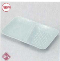
151-504-781 1,310円 青白磁 エンボス仕切皿 (18.7×12.3×2.1) 1115150478