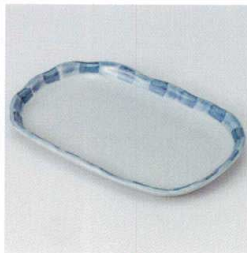
151-304-791 540円 ダミ刷毛6.0小判皿 (17.3×11.2×1.5) 618630479