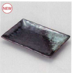
151-502-791 500円 軽量白吹き6.0寸皿 (17.7×12×2.2) 1115150279