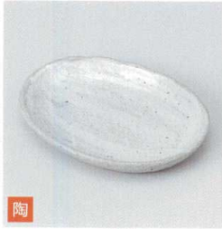
151-301-601 460円 粉引青釉豆大皿 (13.8×10.6×1.9) 541903760