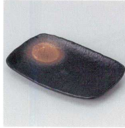
151-101-741 550円 黒備前6.0長角皿 (17.5×12×2) 513740474