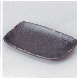
151-103-791 550円 点遊び(黒)6.0長皿 (17.8×2.1) 513710571