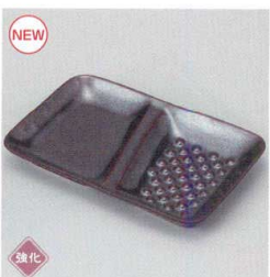
151-505-741 1,310円 鉄鈔エンボス仕切皿 (18.7×12.3×2.1) 1115150574

刺身 向付 中鉢 小鉢 小付 珍味 松花堂 前菜皿 付皿 焼物皿 天皿 香水 蓋物 蒸碗 土瓶蓋し 小皿 和皿 多用皿 多用鉢 盛込鉢 盛込皿 酒器 フリー カップ そば用品 めん皿 多用井 流佐見焼 特選 茶漬碗 飯碗 土瓶 ポット 急須 湯呑 千茶 カスター 卓上小物 箸置 レンジ スプーン 灰皿