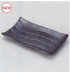
151-501-151 700円 波黒四ツ足串皿 (16.3×10×2) 1115150115