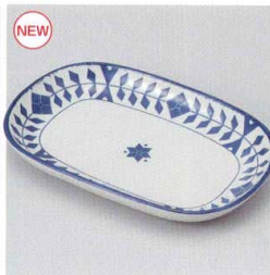
151-202-411 550円 北歐風小判皿 (18.7×12.5×2.6) 1115120241