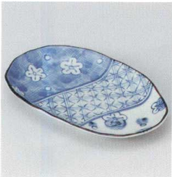
151-401-401 430円 梅祥瑞銘々皿 (13.8×11.5×2.5) 819150440