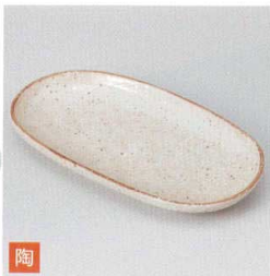
151-403-791 500円 瀬サビ精円皿 (17.7×9.4×2) 518350479