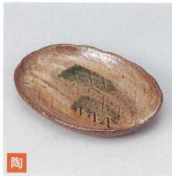
151-303-511 460円 黄瀬戸まめ皿(大) (13.4×10.3×1.6) 518130551