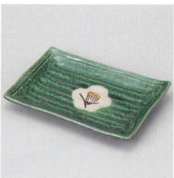
151-503-781 780円 織部椿6.0焼物皿 (18×12×2.1) 1115150378