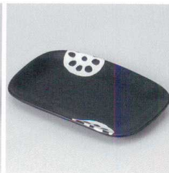
151-105-471 800円 れんこん長角皿(黒) (17.5×11.8×1.5) 914540347