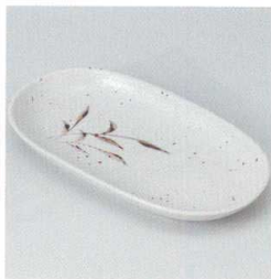
151-305-611 430円 白芦おかず皿 (18×10×2.1) 713150461