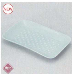
151-405-781 1,040円 青白磁 エンボス長角皿 (17×10.8×2.5) 1115140578