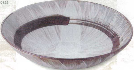
242-203-301 7,500円 白刷毛サビ引10.0鉢(30.2×8.2) 522930230