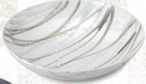
242-303-251 6,900円 白マット十草尺鉢(φ30.2×8.1) 823610125