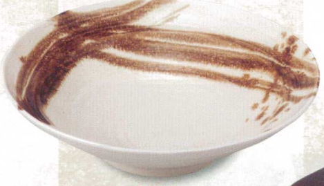
242-301-611 6,000円 すずきの10.0盛鉢(31×8.2) 823540361