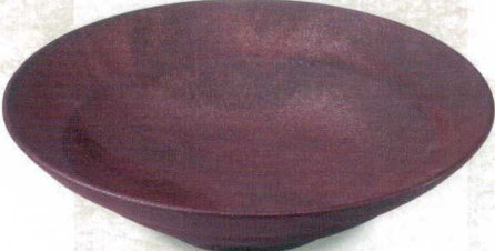
242-102-251 9,000円 朱鉄結晶尺おぼんざい鉢(30×7.5) 1024810125