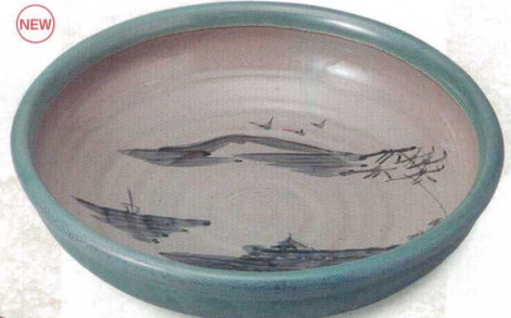
陶 242-101-331 15,000円 麒麟大鉢(29×7.2) 1124210133