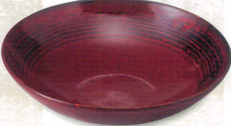
242-201-311 7,000円 赤天目流し10.0鉢(30×7.5) 1024810231