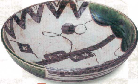
陶 242-202-251 7,000円 志野織部尺大鉢(30.3×7.2) 924620425