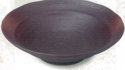
242-302-611 6,000円 藤次郎10.0盛鉢(31×8.2) 823540161