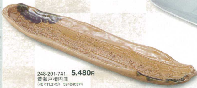
248-201-741 5,480円 黄瀬戸楕円皿 (46×11.3×3) 524240374