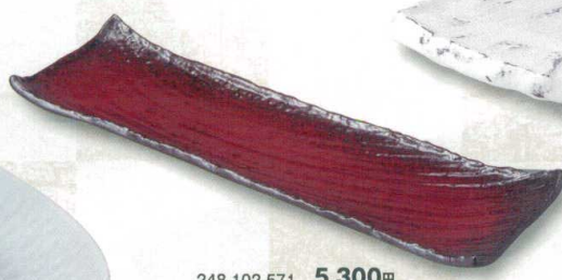
248-102-571 5,300円 朱雲 長角皿 大 (41×13×4) 824540157