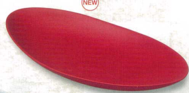
NEW 248-203-261 3,300円 700nm 34.5cmオーバル (34.5×18.2×5.5) 1124820326