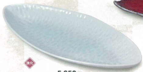
珠化 248-101-741 5,650円 青磁楕円大皿 (41.5×17.6×4.5) 621110174