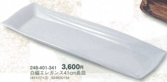
248-401-341 3,600円 白磁エレガンス41cm長皿 (41×17×3) 524830134