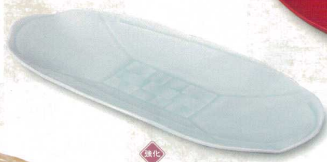
珠化 248-202-051 4,450円 青磁楕円尺3寸皿 (39.2×16×3.5) 510220305