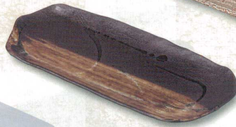
248-402-251 2,000円 流木長角皿 大 (35.8×16.3×2) 814810325