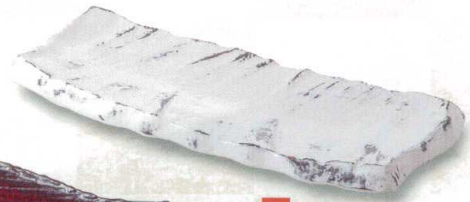
陶 248-103-301 5,200円 粉引拭取りガタ彫12.0皿 (37×14.5×4) 524330130