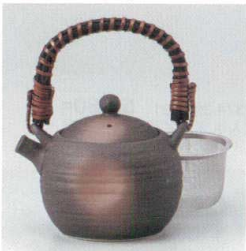
373-304-511 2,700円 黒伊賀吹玉土瓶(カゴアミ付) (10.5×9×280cc) 534650451