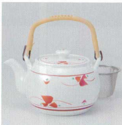
373-105-471 5,800円 赤絵小花土瓶 (16.5×12.5×10.5×800cc) 1137310547