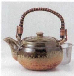
373-203-011 3,500円 グリーン伊良保5号土瓶(U・茶コシ付) (19×12×750cc) 835120201