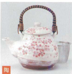
373-205-521 3,600円 平安桜土瓶Uアミ付 (11.5×14×770cc) 534610552