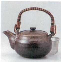
373-204-011 3,500円 金彩5号土瓶(U・茶コシ付) (19×12×750cc) 835120101