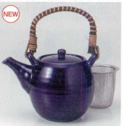
373-505-521 4,100円 夜空土瓶(アミ付)大 (16×10.3×11.3×530cc) 1037940352