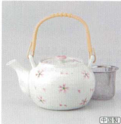
373-302-201 2,000円 さくら淡雪4号土瓶 (12×10×720cc) 1037940520