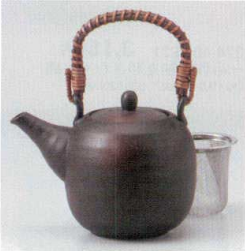
373-403-151 3,600円 備前丸土瓶(カゴアミ付) (14.3×9.8×11.5×520cc) 534720515