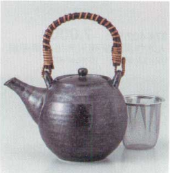
373-404-521 4,000円 銀黒土瓶(アミ付)大 (16×10.3×11.3×530cc) 1037940452