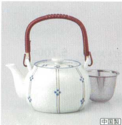
373-303-521 2,650円 十草丸紋青5号土瓶 (13×9.8×520cc) 1037930552