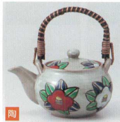
373-104-511 2,730円 染錦椿(中)土瓶 (16.5×10.5×600cc) 937530351