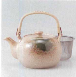
373-301-471 4,400円 伊賀織部5号土瓶(カゴアミ付) (13.3×11.5×800cc) 937530447