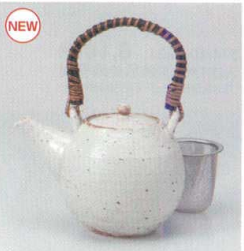
373-405-601 3,800円 サビ志野土瓶(大) (16×10.3×11.3×530cc) 1137340560