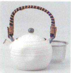
373-305-511 2,700円 粉引玉土瓶(カゴアミ付) (10.5×9×280cc) 534650251