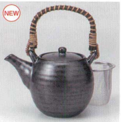
373-504-521 4,000円 漆黒土瓶(小) (13.5×19.4×10.1×350cc) 1137350452