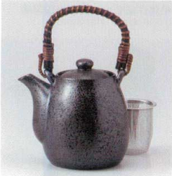
373-501-351 2,980円 黒結晶土瓶(カゴアミ付) (9×12×400cc) 835150135