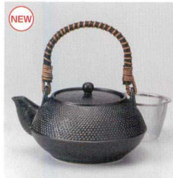
373-201-251 4,000円 あられ土瓶 鉄黒 (17.1×14.7×9.5×800cc) 1137320125