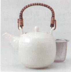
373-402-151 3,600円 粉引丸土瓶(カゴアミ付) (14.3×9.8×11.5×520cc) 534730515