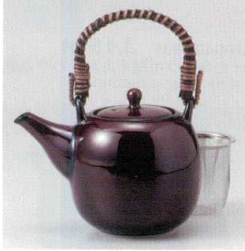
373-401-521 4,200円 うるし釉土瓶Uアミ付 (10.5×11.5×520cc) 534710152