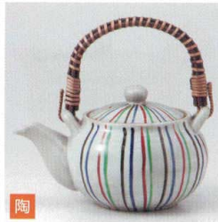
373-103-511 2,730円 十草中土瓶 (16.5×10.5×600cc) 534530351