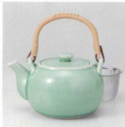
373-202-471 3,860円 ビードロ灰釉土瓶 (13.3×11×800cc) 1137320247