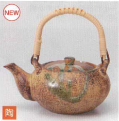
373-503-751 2,000円 織部流し土瓶 (11×7.5×400cc) 1137350375