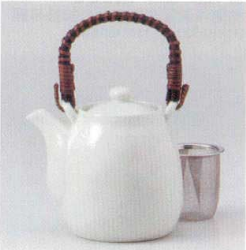
373-502-351 2,980円 セミマット土瓶(カゴアミ付) (9×12×400cc) 835150235