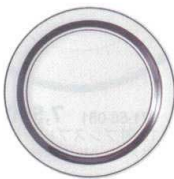
572-51-301 880円 6 1/2 吋パン皿 (16.4 × 1.6) 1057205130