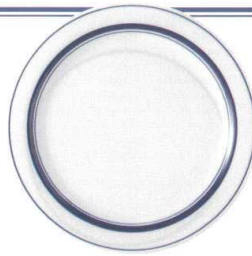
572-3-301 1,530円 9 吋ミート (23.5 × 2.1) 955900330