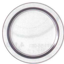
572-52-301 1,150円 7 1/2 吋ケーキ (19.4 × 1.8) 1057205230