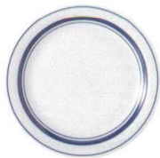
572-1-301 880円 6 1/2 吋パン皿 (16.4 × 1.6) 955900130