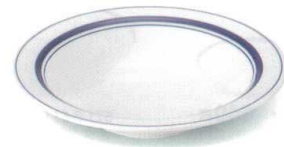
572-8-301 1,980円 9 吋スープ皿 (23.2 × 4.3) 955900830