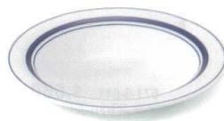
572-7-301 1,630円 8 吋スープ (21.1 × 3.7) 955900730