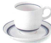
572-14-301 1,380円 アメリカン碗 (11 × 8.1 × 8・265cc) 955901430