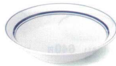
572-6-301 1,630円 7 1/2 吋クープ (18.8 × 3.8) 955900630