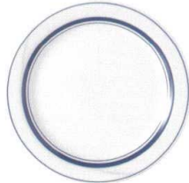
572-2-301 1,150円 7 1/2 吋ケーキ (19.4 × 1.8) 955900230