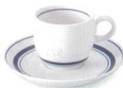
572-10-301 1,100円 コーヒー碗 (9.7 × 7.1 × 6.4・165cc) 955901030