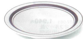
572-58-301 1,980円 9 吋スープ (23.2 × 4.3) 1057205830