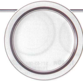
572-54-301 2,700円 10 吋ディナー (26.2 × 2.6) 1057205430