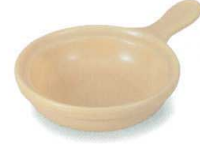
632-104-101 830円 D 目玉焼Y(弱火) (11.3×3.8) 560830510