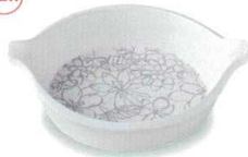
632-101-781 2,300円 H アヒージョ鍋 白 (φ17×5.4) 1163210178