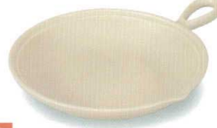
632-202-841 1,350円 A|E ブルーソースパン (19×13×4.8) 560820684