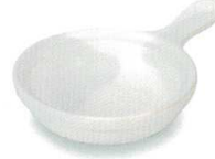
632-103-101 830円 D 目玉焼W(弱火) (11.3×3.8) 560830410