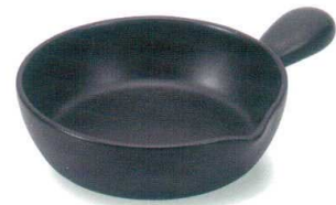
632-204-811 2,500円 F 耐熱ソースパン大 (26.5×18×5) 560840681