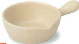
632-201-841 1,000円 A|E クックメイト 丸グラタン (14.8×12.7×5) 560810184