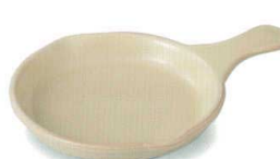
632-403-511 2,900円 B|H フランチャイロー片手ステーキ(小) (24.6×18×3.8) 560850351