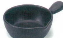
632-303-811 1,400円 A|E 耐熱ソースパン小 (19.5×12.5×4.8) 560840581