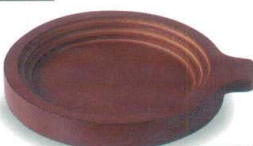
632-304-601 4,200円 F 耐熱黒 フォンデュ(大) (26.3×18.2×7.2) 963140260 632-305-601 3,300円 B|H 耐熱黒 フォンデュ(小) (22×15.5×6.1) 963140160