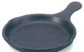
632-301-601 3,100円 B|H 耐熱黒 片手ステーキ(小) (24.8×18.2×4.4) 963130460