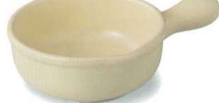
632-404-511 4,450円 F フランチャイローフォンデュ(大) (26.4×18.1×7.2) 560850151 632-405-511 3,200円 B|H フランチャイローフォンデュ(小) (22×15.3×6.1) 560850251