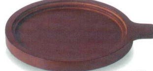
632-401-031 1,850円 木台 S (17.5×11.5×2.2) 949220203