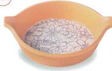
632-102-781 2,300円 H アヒージョ鍋 オレンジ (φ17×5.4) 1163210278