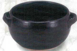
722-102-841 2,100円 ③ 耐熱黒釉シチューボール (17.5×13.3×8) 661740584