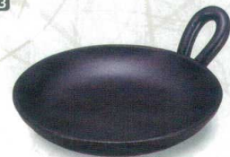
722-306-811 1,800円 ④ 手付耐熱プレート (19.5×16×3) 1071610381