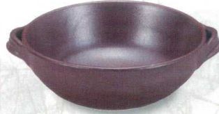
722-103-841 2,200円 ④ 耐熱鉄砂盛鉢ボール (23×20×7) 665040384