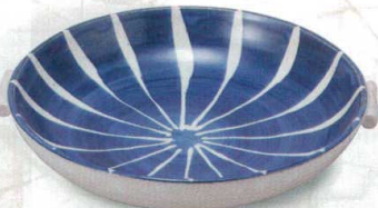
722-401-781 2,500円 ⑤ 呉須十草 土鍋皿 (23×21×4) 1172240178