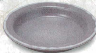
722-404-841 2,000円 ⑤ グレー柳川皿 (20×3) 564710584