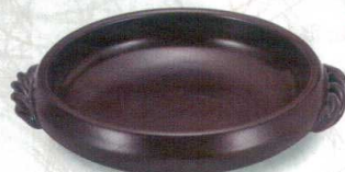
722-304-821 2,100円 ④ 6.0深陶板 (24.5×18.5×5) 564530684