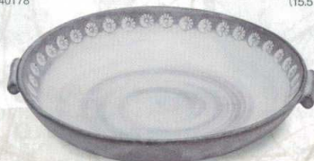
722-402-251 2,500円 ⑤ 三島紋耐熱土鍋皿 (23×21×4) 971630525