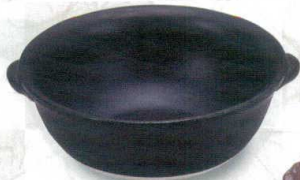
722-201-821 2,500円 ④ 超耐熱 漆黒拉麺鍋 (23×21×8) 764420382