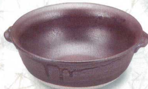
722-202-821 2,500円 ④ 超耐熱 鉄赤拉麺鍋 (23×21×8) 764420482