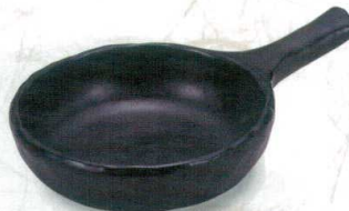
722-305-841 1,900円 ③ 黒片手フライパン (23×15×5.5) 1071610584