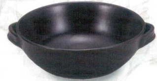
722-104-841 2,200円 ④ 耐熱黒釉盛鉢ボール (23×20×7) 665040184