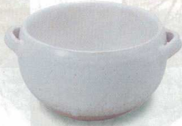
722-101-841 2,100円 ③ 耐熱白釉シチューボール (17.5×13.3×8) 661740684