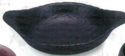
722-203-841 3,000円 ⑥ 黒7号盛鉢陶板 (29×23×7) 1071620484