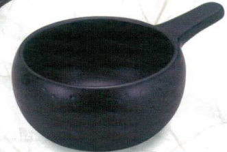
722-204-811 3,500円 ④ 耐熱手付ラーメン鍋 (26.5×18×9.5) 971350381