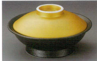
20009-010 金彩黒油滴平蓋向 4,850円 (171×91mm)