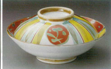
20004-010 十草赤丸紋平蓋向(小) 3,800円 (163×87mm) 20005-010 十草赤丸紋骨むし(大) 5,800円 (213×100mm)