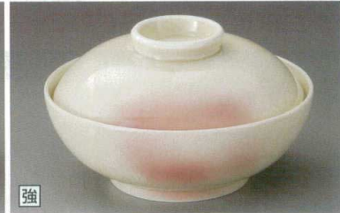
20017-150 紅ボカシ蓋向 2,800円 (150×90mm)