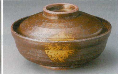
20014-180 華備前(土物)6.0蓋物 3,700円 (185×103mm)