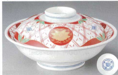
20006-460 華陽紋7.0骨むし 6,900円 (215×105mm)