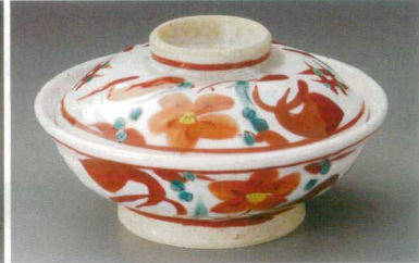
20011-450 志野赤絵蓋向付 4,600円 (165×95mm)