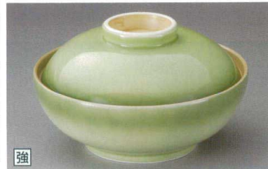
20015-320 緑彩蓋向(丸型) 3,200円 (148×85mm)