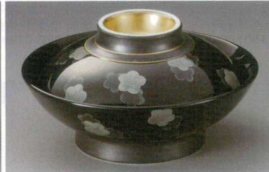
20013-050 金巻花ちらし蓋向 3,800円 (165×88mm)