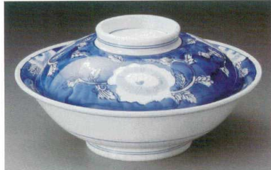
20001-010 一珍牡丹7.0骨むし 6,000円 (210×95mm) 20002-010 一珍牡丹8.0骨むし 8,800円 (248×110mm)