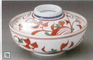
20010-320 赤絵万歴蓋向 5,800円 (160×95mm)