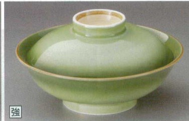
20016-310 緑彩平蓋向 3,150円 (167×90mm)