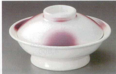
20007-010 マロン吹銀彩平蓋向 5,200円 (171×91mm)