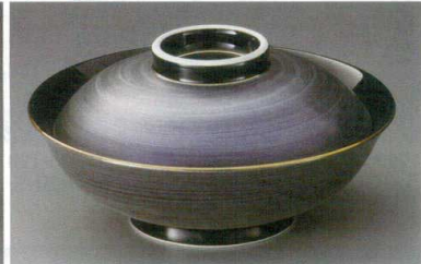
20008-320 彩光ライラック蓋向 5,820円 (167×90mm)