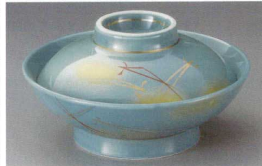
20012-050 ヒスイ金松蓋向 4,500円 (165×88mm)