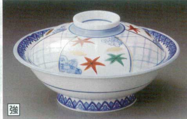
20003-310 間取紅葉7.0骨むし 7,110円 (220×115mm)