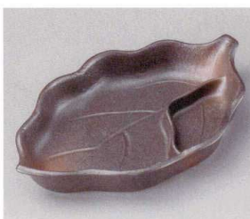
26514-170 備前葉型仕切皿 1,200円 (216×130×30mm)