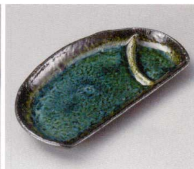
26504-020 ゆず黒銀河半月仕切皿 1,150円 (238×128×27mm)