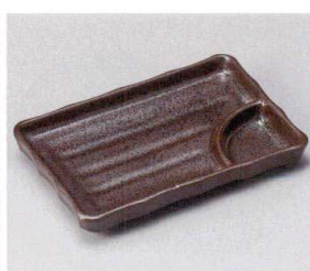
26507-320 鉄線花7.0長角仕切皿 1,300円 (185×129×23mm)