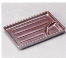
26511-460 紅銀彩7.0仕切付長角皿 1,170円 (205×135×22mm)