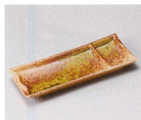
26513-170 伊賀の里竹割り仕切皿(大) 1,180円 (248×95×27mm)