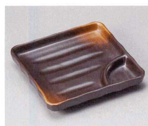
26509-460 焼締正角仕切皿 1,290円 (166×166×30mm)