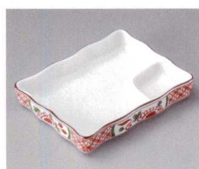
26505-170 赤絵祥瑞波型仕切皿 1,260円 (156×120×30mm)