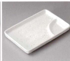
26520-050 粉引ソギ仕切皿 1,050円 (205×140×25mm)