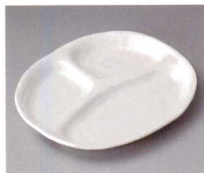
26501-180 白釉三ツ切10吋仕切皿 1,450円 (248×213×22mm)