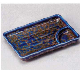
26506-460 いろり7.0長角仕切皿 1,440円 (190×133×25mm)