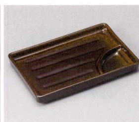
26512-460 金彩天目7.0仕切付長角皿 1,170円 (205×135×22mm)