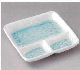
26518-150 白流水正角仕切皿 1,100円 (176×168×30mm)