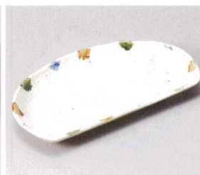
26516-180 三彩 半月仕切皿 1,150円 (240×130×30mm)