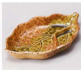
26515-170 伊賀の里葉型仕切皿 1,170円 (216×133×32mm)