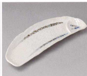
26519-150 オフケライン半月仕切付多用皿 1,100円 (315×120×24mm)