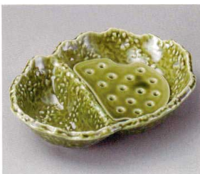
26502-350 織部冷奴鉢スノコ付 1,300円 (200×150×45mm)