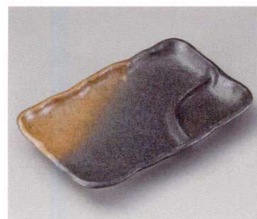
26517-230 黒備前焼物仕切皿 1,100円 (210×140×25mm)