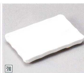
26508-460 白磁7.0長角仕切皿 1,150円 (190×133×25mm)