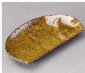
26503-400 黄河流半月仕切付皿 1,180円 (240×130×28mm)