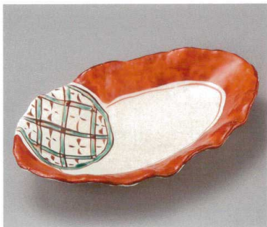
33005-020 緑格子花型ダ円皿 3,800円 (267×162×48mm)