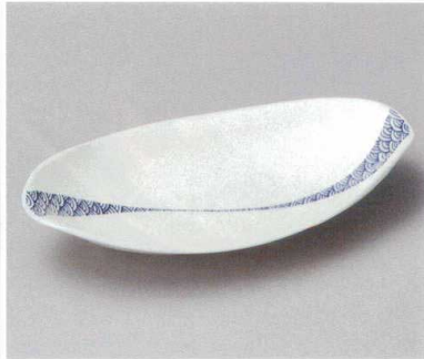
33004-400 波絵光彩ラスター多用皿(有田焼) 3,900円 (260×140×43mm)