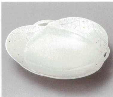
33013-120 ラスタープチドット前菜皿 3,600円 (200×200×42mm)