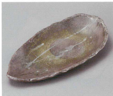
33012-430 炭化ボタモチ10.0変型皿 3,620円 (310×165×40mm)