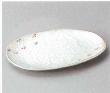
33010-410 雪化粧小判中皿 2,000円 (190×140×15mm) 33011-410 雪化粧小判プラター(大) 3,700円 (280×190×20mm)