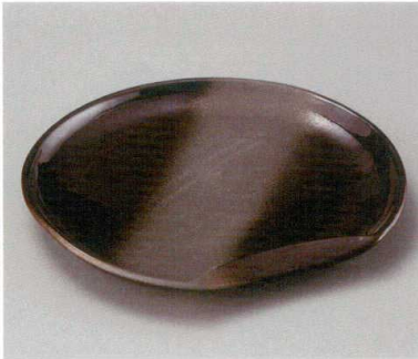
33002-460 備前灰釉7.0半月丸皿 1,930円 (215×200×25mm) 33003-460 備前灰釉9.0半月丸皿 3,900円 (270×255×25mm)