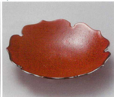
33014-080 紅柚子天目輪花7.0皿 3,600円 (230×58mm)