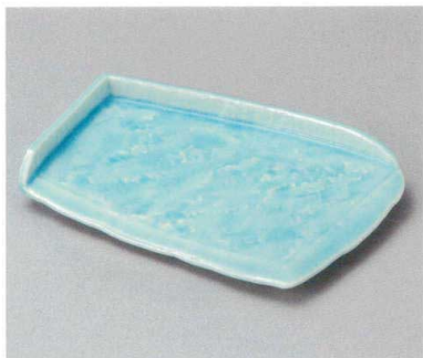
33008-180 湖水屏風型 前菜皿 3,780円 (270×185×40mm)