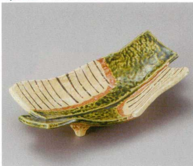
33006-010 織部細十草10.0盛皿 3,800円 (300×150×70mm)