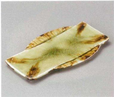
33001-180 灰釉耳付長大皿 4,000円 (308×173×15mm)