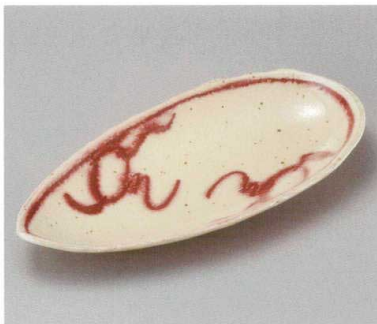
33009-430 赤絵変形皿 3,750円 (305×160×45mm)