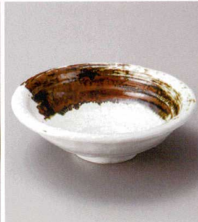
36312-210 白茶刷毛たわみ鉢(大) 4,000円 (260×250×78mm)