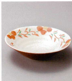
36317-180 朱巻唐草花リップル8.5鉢 3,750円 (263×73mm)