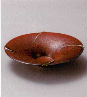
36302-010 紅柚子9.0反型鉢 4,500円 (270×60mm)