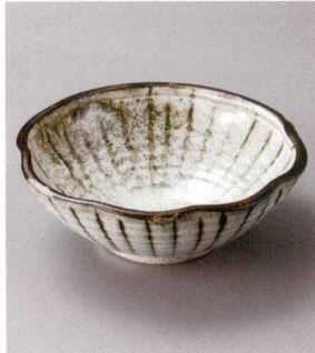
36309-020 うのふ十草流し8.5盛鉢 4,400円 (257×247×90mm)