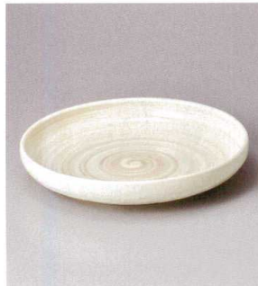
36305-460 東風石目10.0盛鉢 4,400円 (315×60mm)