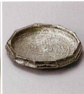
36318-460 白柚子天目面取8.0鉢 3,700円 (245×245×45mm)