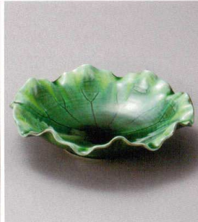
36313-030 緑釉黄流し波瀾8.5盛鉢 4,000円 (254×68mm)