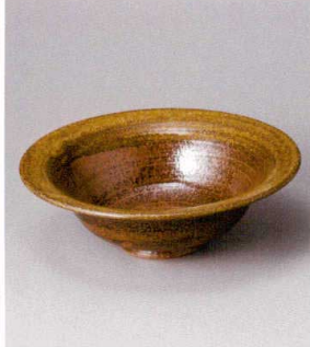
36304-080 備前流し9.5反井 4,500円 (283×94mm)