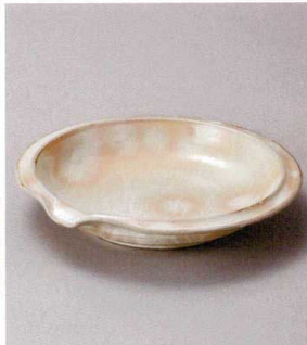
36311-460 御本手 9.5片口形盛鉢 4,250円 (290×50mm)