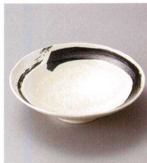
36314-280 白海流8.0盛鉢 3,800円 (250×70mm) 36315-280 白海流9.0盛鉢 5,200円 (270×70mm) 36316-280 白海流尺盛鉢 7,600円 (310×82mm)