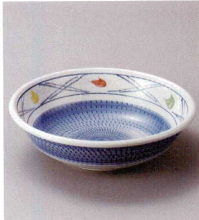
36301-180 三彩トチリ9.0盛鉢 4,600円 (280×80mm)