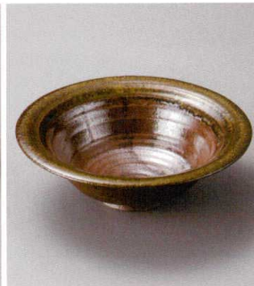
36319-080 備前流し8.0反井 3,650円 (252×80mm)