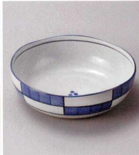
36307-460 古染市松7.0大鉢 4,400円 (215×75mm) 36308-460 古染市松8.0大鉢 4,950円 (255×77mm)