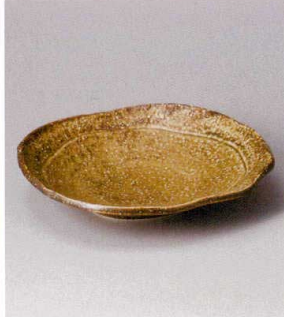
36303-460 不動石目形大盛皿 4,500円 (280×60mm)