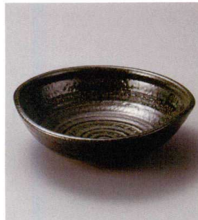
36310-010 紺ビード口9.0平鉢 4,300円 (272×265×88mm)