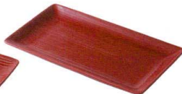
59107-820 朱 千段焼物皿 1,700円 (238×135×25mm)