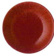
59104-820 朱 千段 7.5皿 1,800円 (237×34mm)