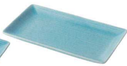
59118-820 トルコ青磁 千段焼物皿 1,300円 (238×135×25mm)