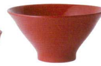
59111-820 朱 6.5千段高ハマ井 2,400円 (200×100mm・1100cc)