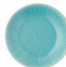
59114-820 トルコ青磁 千段5.5皿 1,100円 (180×26mm)