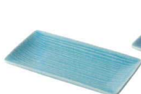
59117-820 トルコ青磁 千段串皿 800円 (180×98×20mm)