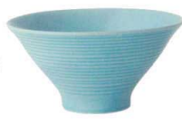
59122-820 トルコ青磁 6.5千段高ハマ井 1,900円 (200×100mm・1100cc)