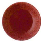
59103-820 朱 千段 5.5皿 1,300円 (180×26mm)