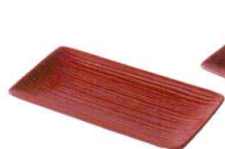
59106-820 朱 千段串皿 950円 (180×98×20mm)