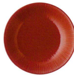
59105-820 朱 千段 10.0皿 5,100円 (305×43mm)