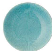
59115-820 トルコ青磁 千段7.5皿 1,500円 (237×34mm)