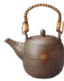
66765-100 土瓶(金アミ付) 3,900円 (142×96×112mm・450cc)