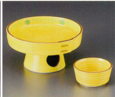
06711-180 三方型高台刺身鉢 4,750円 (143×70mm) 06712-180 三方型丸千代口 1,750円 (70×34mm)