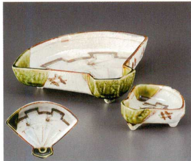
06701-120 織部扇面刺身鉢 6,500円 (180×150×50mm) 06702-120 織部扇面千代口 2,000円 (85×75×35mm)