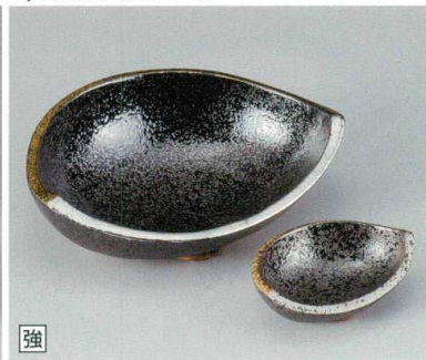
06717-460 黒ちらし口金銀5.5半月形井 4,250円 (190×135×60mm) 06718-460 黒ちらし口金銀半月形小々井 1,480円 (100×70×35mm)