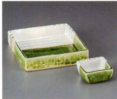
06707-460 織部十草角形小鉢(大) 5,000円 (150×150×35mm) 06708-460 織部十草角形千代口 1,750円 (65×65×32mm)