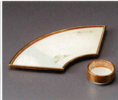
06709-180 赤巻武蔵野扇面皿 4,800円 (300×140×18mm) 06710-180 赤巻武蔵野千代口 1,850円 (65×30mm)