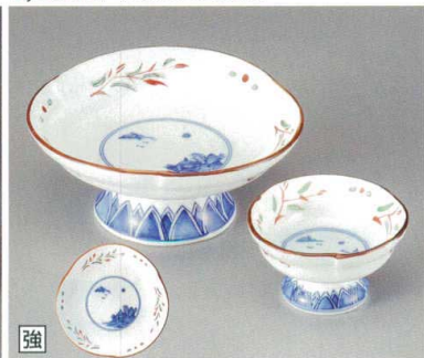
06723-080 赤絵京山水刺身 4,200円 (150×70mm) 06724-080 赤絵京山水千代口 1,600円 (85×50mm)