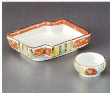
06721-010 十草赤丸紋刺身 4,200円 (165×130×43mm) 06722-010 十草赤丸紋千代口 1,400円 (72×34mm)