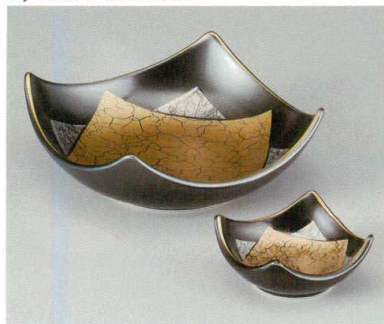
06719-010 四角マット金銀彩刺身 4,250円 (160×57mm) 06720-010 四角マット金銀彩千代口 1,400円 (78×35mm)