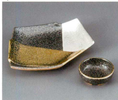
06713-450 南蛮金銀彩結び皿 4,400円 (210×155×30mm) 06714-450 南蛮金銀彩丸千代口 1,100円 (70×25mm)