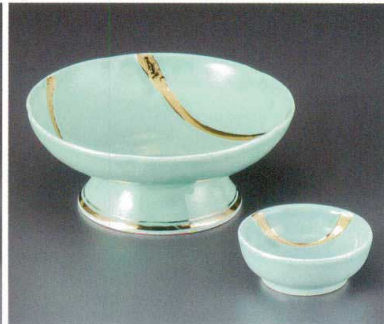
06705-220 強化雅高台向付 5,100円 (164×65mm) 06706-220 強化雅高台千代口 1,200円 (78×29mm)