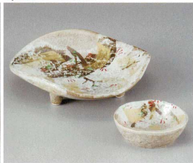
06715-220 金彩唐津三ツ足向付 4,300円 (170×160×45mm) 06716-220 金彩唐津千代口 1,500円 (80×26mm)