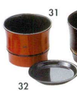
68331-560 [M]竹型つゆ入れ 根来 900円 (80×60mm) 68332-560 [M]ヤクミ皿 黒 250円 (81×10mm)