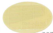
洗浄機OK 68308-560 15φ丸 350円 (150mm)