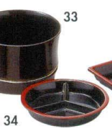
68333-560 [M]竹型汁入(特大) 溜金線 1,550円 (100×66mm) 68334-560 [M]三ッ切ヤクミ皿 黒天朱 500円 (101×16mm)