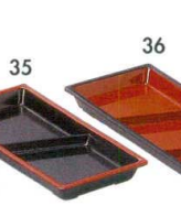
68335-560 [A]ABS二点薬味入れ 黒天朱 650円 (153×77×18mm) 68336-560 [A]ABS三点薬味入れ 朱天黒 830円 (194×78×18mm)