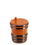
68326-560 [AC]タル型七味入れ 朱に帯黒 595円 (58×70mm)