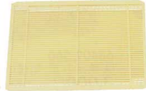
洗浄機OK 68305-560 15.5cm角 390円 (155×155mm)