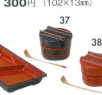
68337-560 [M](小)桶型ヤクミ入れ 黒帯朱(小さじ付) 1,450円 (53×41mm) 68338-560 [M](小)桶型ヤクミ入れ 朱帯黒(小さじ付) 1,450円 (53×41mm)