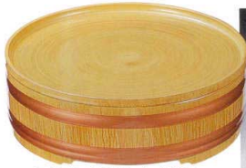
[A]尺0寸桶鉢 白木帯金 68301-560 本体 3,600円 (296×88mm) 68302-560 蓋 1,950円 (297×17mm) 積み重ね可能です。