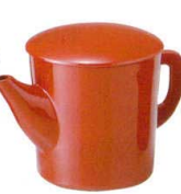
68323-560 [A](小)ゆとう 朱 1,450円 (90×95mm)