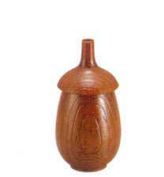
68325-560 [A]なす型薬味入れ ケヤキ 1,200円 (50×100mm)