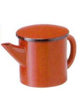
68324-560 [A]ミニゆとう 朱 黒 1,430円 (75×80mm)