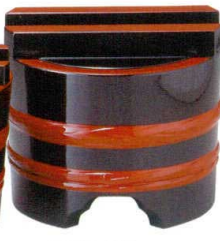
68330-560 [A](大)釜揚げ 黒帯朱 10,300円 (210×190mm)