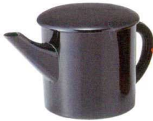
68322-560 [A](大)ゆとう 黒 2,300円 (106×101mm)