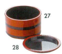
68327-560 [A]桶型つゆ入れ 朱に帯黒 700円 (100×60mm) 68328-560 [A]D.Xヤクミ皿 黒天朱 300円 (102×13mm)