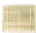
洗浄機OK 68304-560 11.5cm角 380円 (115×115mm)

測付タイプは、枠を太く強化しており、破損しにくくなっています。(PAT) ●洗浄、乾燥等を効果的に行うことができる優れた商品です。 ●竹ス実物の質感を細部まで表現したとても衛生的な商品です。 ●乾燥機での使用はなるべく避け下さい。