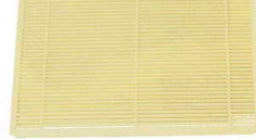
洗浄機OK 68306-560 17cm角 390円 (170×170mm)