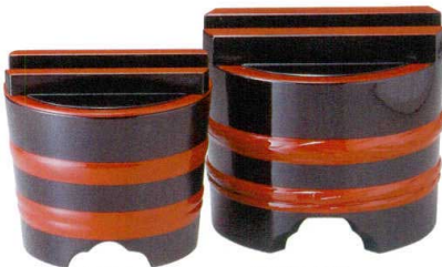
68329-560 [A](小)釜揚げ 黒帯朱 浅型 4,800円 (176×160mm)