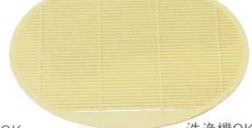
洗浄機OK 68309-560 19.6φ丸 400円 (196mm)