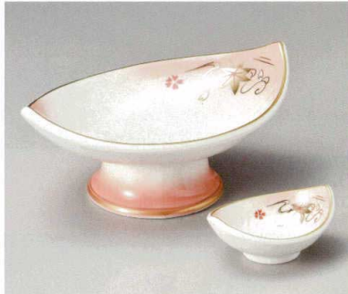
06909-330 オレンジ吹舟型高台刺身 3,700円 (215×138×80mm) 06910-330 オレンジ吹舟型千代口 1,300円 (90×68×35mm)