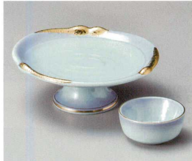
06907-010 金彩マロン青地向付 3,750円 (152×56mm) 06908-010 金彩マロン青地千代口 950円 (67×30mm)