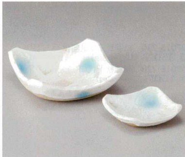
06915-410 青粉引正角刺身鉢 3,630円 (135×45mm) 06916-410 青粉引正角小皿 1,400円 (90×20mm)