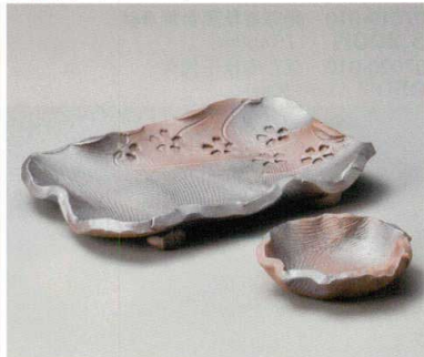
06923-070 手造り焼ば流氷刺身皿 3,500円 (215×140×37mm) 06924-070 手造り焼ば丸千代口 1,200円 (80×20mm)