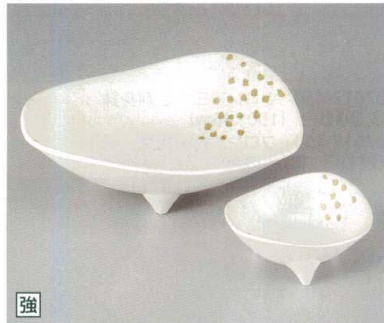
06913-320 金吹雪刺身鉢 3,640円 (183×142×56mm) 06914-320 金吹雪千代口 1,330円 (93×78×40mm)