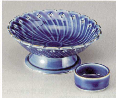
06905-180 コバルトスカーン高台向付 3,700円 (167×68mm) 06906-180 コバルトスカーン丸千代口 780円 (63×30mm)