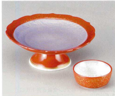
06901-330 しずか高台向付 3,800円 (157×58mm) 06902-330 しずか丸千代口 1,200円 (65×30mm)