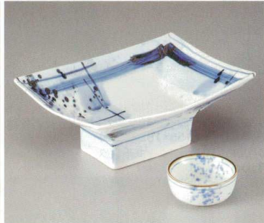
06911-460 染付呉須格子 長角高台向付 3,650円 (200×145×80mm) 06912-460 吹墨 丸千代口 890円 (65×30mm)