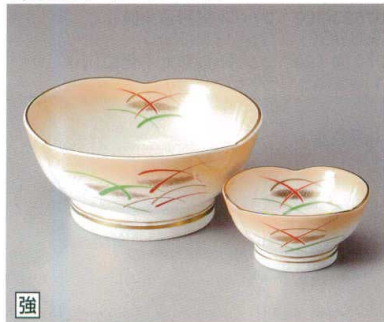
06919-080 加茂川三ツ山刺身 3,600円 (150×70mm) 06920-080 加茂川三ツ山千代口 1,500円 (88×45mm)