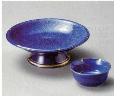
06917-010 エンカ巻刺身鉢 3,600円 (165×52mm) 06918-010 エンカ巻千代口 900円 (75×30mm)