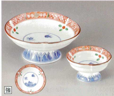
06903-010 強化万歴高台刺身鉢 3,700円 (150×65mm) 06904-010 強化万歴高台千代口 1,400円 (90×50mm)