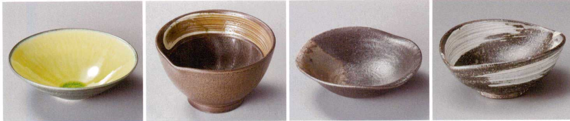
08901-430 黄緑5.8鉢 3,500円 (175×55mm) (信楽焼) 08902-430 黒土刷毛目すり鉢(中) 3,500円 (145×140×80mm) (信楽焼) 08903-430 窯変5.6変形鉢 3,500円 (168×168×52mm) 08904-430 刷毛目あみがさ小鉢 3,500円 (150×130×60mm)