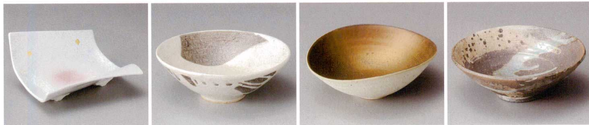
08905-030 ラスターピンク吹ウェーブ向付 3,500円 (185×185×95mm) 08906-430 粉引流し向付 3,500円 (168×58mm) (信楽焼) 08907-430 焼ぎ金彩楕円向付 3,500円 (170×152×60mm) (信楽焼) 08908-430 窯変刷毛目流し向付 3,500円 (167×59mm) (信楽焼)