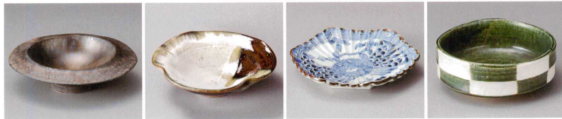
08909-080 金結晶反型7寸向付 3,500円 (210×200×67mm) 08910-120 唐津段付四押し6.5鉢 3,500円 (196×191×68mm) 08911-300 染付祥瑞見込うぎぎ菊彫六角皿 3,400円 (185×175×50mm) 08912-220 銀彩織部市松切立5寸鉢 3,400円 (142×55mm)