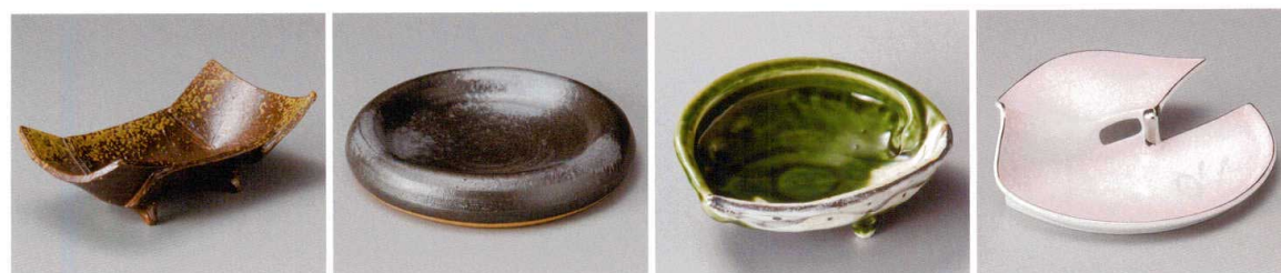
08917-180 備前灰吹トジメ向付 3,350円 (184×102×65mm) 08918-180 黒オリベ 鉄吹丸たわみ鉢 3,350円 (195×35mm) 08919-180 絵織部あわび形向付 3,350円 (163×137×58mm) 08920-180 ピンク白吹二段向付 3,350円 (215×195×70mm)