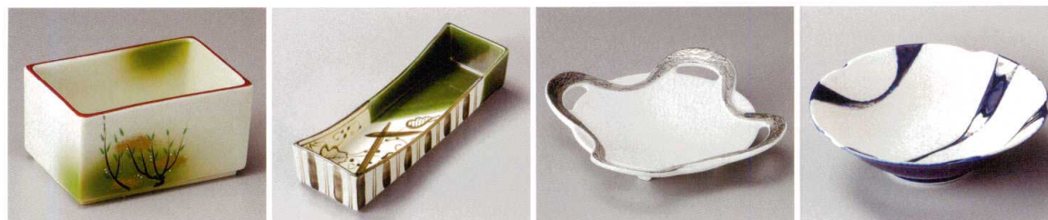
09117-180 京柳長角向付 3,050円 (125×85×65mm) 09118-460 織部つた絵長角切立前菜皿 3,050円 (260×85×55mm) 09119-010 NBプラチナリボン向付 3,000円 (160×40mm) 09120-400 ルリ釉流水ラスター花型多用鉢 3,000円 (156×45mm)有田焼