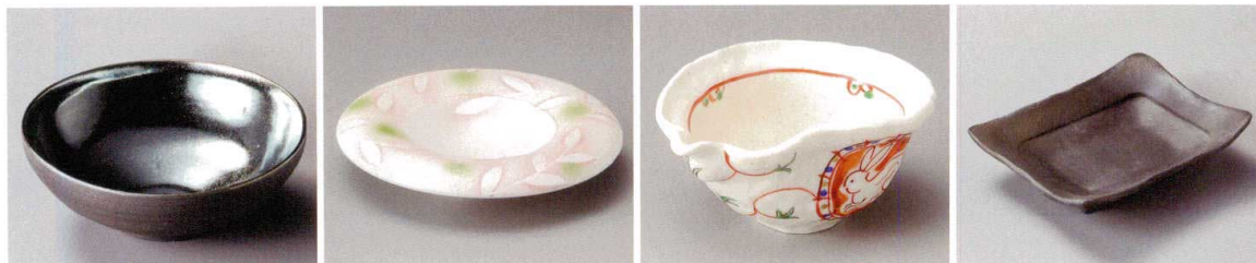
09101-430 光彩黒焼♫5.6丸鉢 3,200円 (170×60mm) 09102-180 ラスターピンク芦ハット型前菜皿 3,200円 (210×45mm) 09103-220 片口ひさご唐草小鉢 3,150円 (150×120×69mm) 09104-430 炭化長角向付 3,150円 (175×140×45mm)