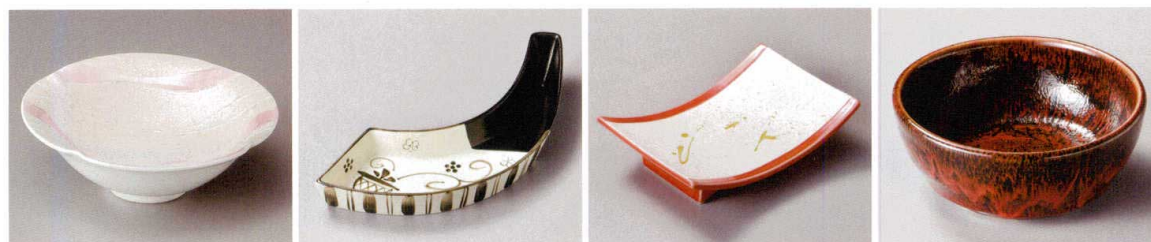
09113-180 ピンク-珍輪花向付 3,080円 (155×52mm) 09114-460 黒織部花かごひねり前菜皿 3,050円 (295×120×35mm) 09115-180 淵赤黄とばしアーチ皿 3,050円 (165×117×45mm) 09116-100 紅柚子玉5.0鉢 3,000円 (152×58mm)