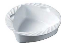
⑨PP トライアングルトライ 深皿