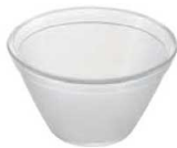
⑦トライタン ボール 10