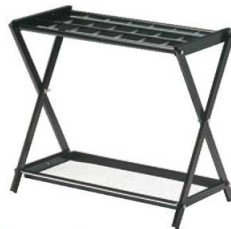
⑦アンブラー ブラック