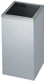
①EBM 18-8 角 レインボックス