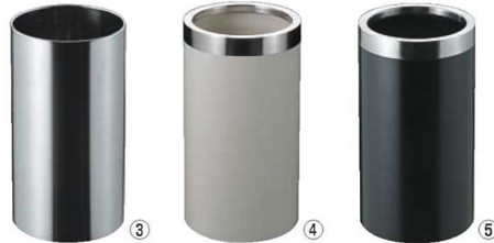
③EBM 18-8 丸 レインボックス (内カール)