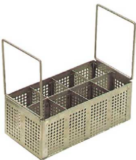
⑯レーバン シルバーコンパートメント バスケット SWB-4SS ㊦