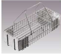
①EBM 18-8 寸胴型 箸消毒カゴ