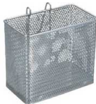
⑦18-8 縦型スプーンカゴ