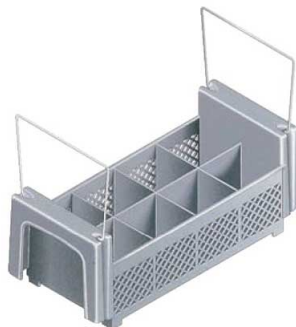
⑰キャンプ フラットウェアバスケット カムラック 8コンパートメント