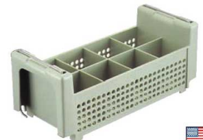
⑱ヴォラース シルバーバスケット 52641 (ライトグリーン) ㊦