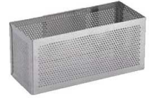
⑥UK 18-8 パンチング スプーンカゴ