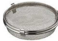
⑪18-8 食洗機用小物カゴ LS1533 ㊦