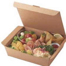
スナックBOX ▶ 関連商品:P2342