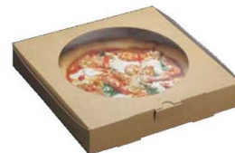
正角クラフトピザBOX 窓付10インチ ▶ 関連商品:P2351