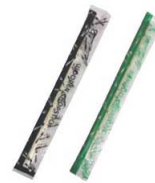
OPP完封箸 ▶ 関連商品:P1447