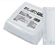
平型おしぼり ▶ 関連商品:P2363