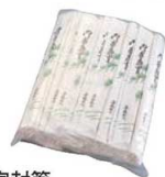
完封箸 アスペン元禄 楊枝入 ▶ 関連商品:P1447