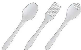
バイオプラスプーン バイオプラフォーク バイオプラフォークスプーン ▶ 関連商品:P2357