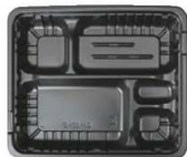
FM 弁当容器 ▶ 関連商品:P2346