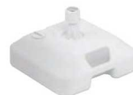
注水型マルチのぼりスタンド ▶ 関連商品:P2009