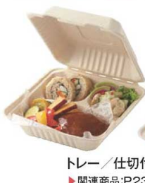
トレー/仕切付 ▶ 関連商品:P2342