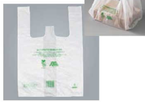
イーザーバッグバイオ ▶ 関連商品:P2367