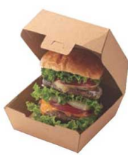
バーガーBOX ▶ 関連商品:P2351