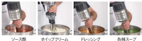
ソース類 ホイップクリーム ドレッシング 各種スープ