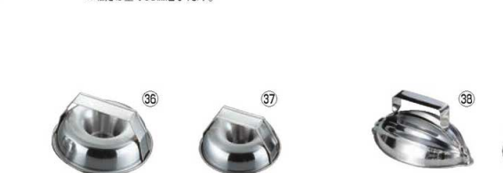
EBM 18-0 ライス型 ドーナツ