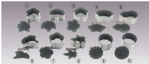
EBM スーパーコート 物相型