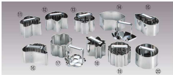
EBM 18-8 物相型