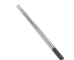
⑧18.8 プラ付 菜箸