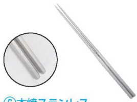
⑥本焼ステンレス 六角柄盛箸