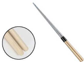
①白木柄 盛箸 (水牛桂付)