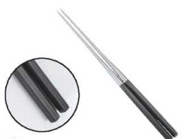
③本焼ステンレス 黒合板 六角柄盛箸