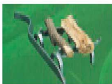
図のように使用するとより効果的です。