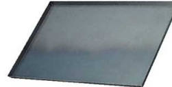
⑭鉄 黒皮 天板