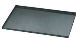
⑬マトファー/ブジャ ストレートエッジ ベーキングトレイ 4550.01