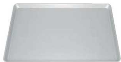
⑪アルマイト加工 ヨーロッパ軽量天板