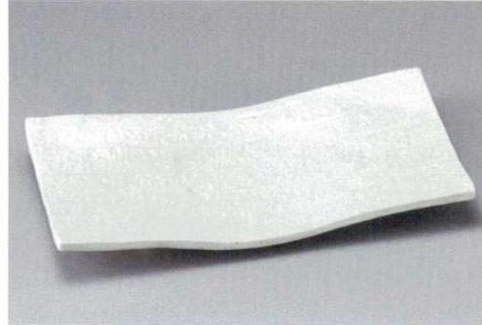
173-02-245 2,500円 粉引まな板皿 (31×16×4.5cm)