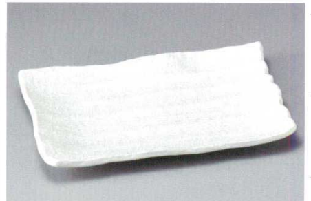
173-06-675 2,450円 しのぎ白長角大皿 (32.5×20×3.4cm)