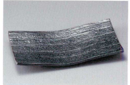
173-03-245 2,500円 南蛮まな板皿 (31×16×4.5cm)