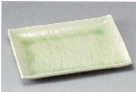
173-11-305 2,380円 ヒワ釉天皿 (28×20.7×3cm)