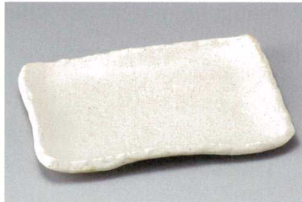
173-05-645 2,450円 桃山27cm長角大皿 (27×19×3cm)