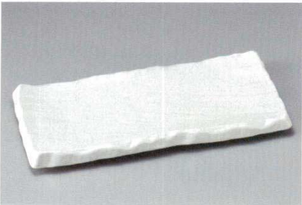
173-10-675 2,400円 白マット荒彫まな板皿 (32.3×15×3.7cm)