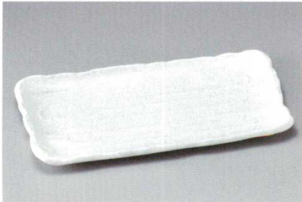
173-04-645 2,500円 白荒削ぎ33cmほっけ皿 (33×18×2.5cm)