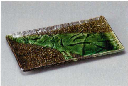
173-07-535 2,500円 天の川9.5長角皿 (28.3×16.8×2cm)