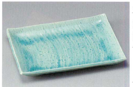
173-12-305 2,380円 トルコ釉天皿 (28×20.7×3cm)