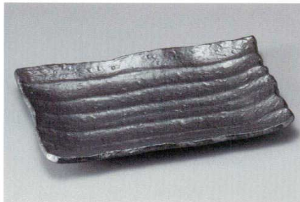
173-08-675 2,450円 しのぎ黒長角大皿 (32.5×20×3.4cm)