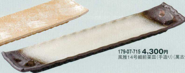
179-07-715 4,300円 風雅14号細前菜皿(手造り)(萬古焼) (44.5×9×3cm)