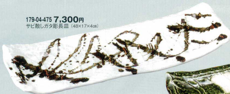
179-04-475 7,300円 サビ散しがた彫長皿 (48×17×4cm)