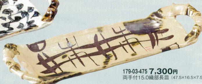
179-03-475 7,300円 両手付15.0織部長皿 (47.5×16.5×7.5cm)