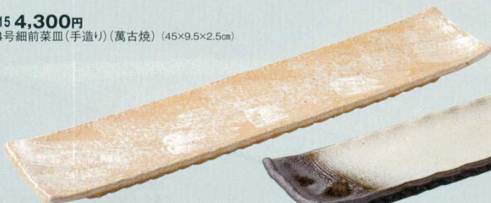
179-06-715 4,300円 志野釉14号細前菜皿(手造り)(萬古焼) (45×9.5×2.5cm)