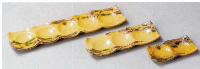
229-17-455 2,800円 黄瀬戸結び皿5連 (30.5×7×2.2cm) 229-18-455 1,800円 黄瀬戸結び皿3連 (19×7×2cm) 229-19-455 1,200円 黄瀬戸結び皿2連 (12×6×1.7cm)