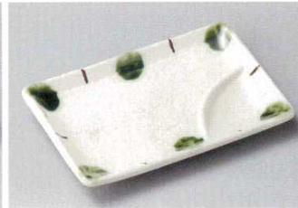
229-03-115 600円 オリベ測十草6.0仕切皿 (17.3×11.3×2.2cm)