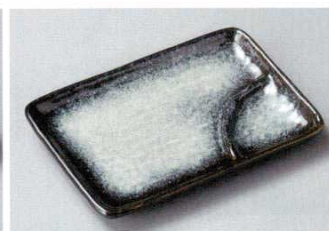
229-07-305 540円 雲竜6寸仕切り皿 (18×12.3×2.4cm)