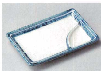
229-09-075 540円 測ライン6.0仕切皿 (17×11×2cm)