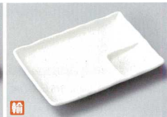
229-16-405 450円 粉引仕切り皿 (17.4×12×2.6cm)