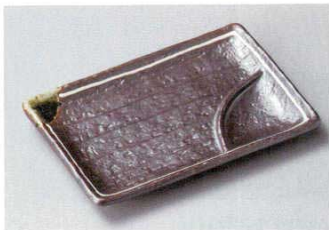
229-01-095 600円 鉄釉一珍ライン6.0仕切皿 (17×11×2cm)