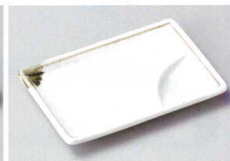
229-08-095 540円 志野ライン6.0仕切皿 (17×11×1.7cm)