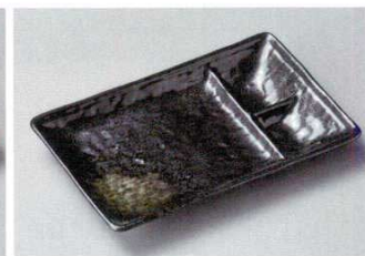
229-12-675 520円 天目白吹トンカツ皿 (21.2×13.5×3cm)