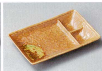
229-11-675 520円 伊賀トンカツ皿 (21.2×13.5×3cm)