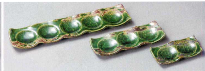
229-20-455 2,800円 オリベ結び皿5連 (30.5×7×2.2cm) 229-21-455 1,800円 オリベ結び皿3連 (19×7×2cm) 229-22-455 1,200円 オリベ結び皿2連 (12×6×1.7cm)