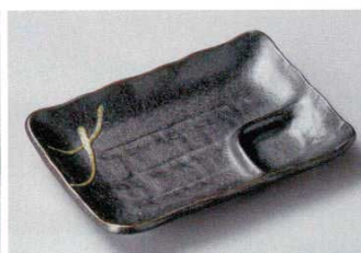
229-06-545 550円 黒マット一珍6.0仕切皿 (16×11×2.5cm)