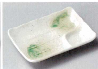
229-14-675 480円 織部吹6.0仕切皿 (17×11.5×2.7cm)