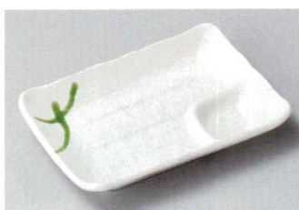
229-05-545 550円 白マット一珍6.0仕切皿 (16×11×2.5cm)