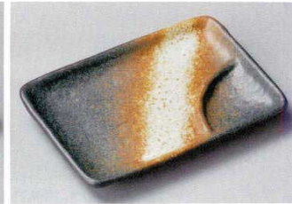
229-04-095 580円 黒備前6.0仕切皿 (17.5×12×2.1cm)