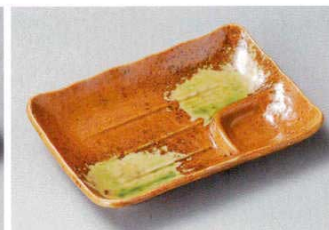
229-15-675 480円 伊賀6.0仕切皿 (17×11.5×2.7cm)