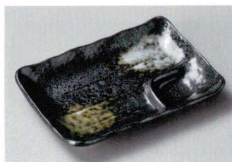
229-13-675 480円 天目白吹6.0仕切皿 (17×11.5×2.7cm)