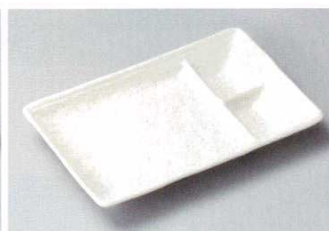
229-10-675 520円 粉引白トンカツ皿 (21.2×13.5×3cm)