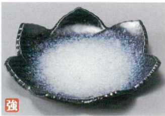
強 302-21-075 2,230円 雲海葉型6.0皿 (18.2×3.2cm)