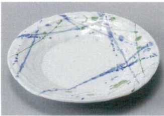
302-20-565 2,250円 砂目2色打6.0皿 (19.2×2.8cm)