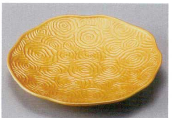
302-07-475 2,800円 金彩渦彫6.0皿 (17.5×2cm)