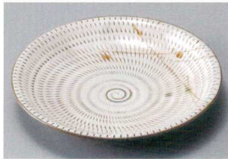
302-08-025 2,780円 手彫り(飛びカンナ)6.0丸皿 (18.5×3cm) 302-09-025 2,090円 手彫り(飛びカンナ)5.5丸皿 (16×3.5cm)