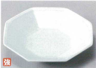
強 302-15-025 2,380円 青磁 6.0八角皿 (17.5×17.5×3.5cm)