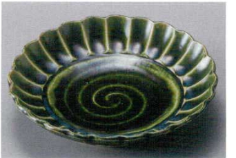
302-16-105 2,350円 総織部菊割中皿 (18×4cm)