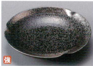
強 302-03-025 3,850円 黒ちらし測銀巻6.0三つ押丸皿 (17.5×3.5cm) 302-04-025 2,510円 黒ちらし測銀巻5.0三つ押丸皿 (14.5×3cm)