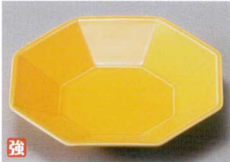
強 302-14-025 2,380円 黄釉 6.0八角皿 (17.5×17.5×3.5cm)