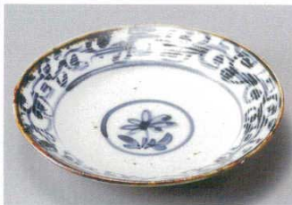
302-06-025 3,100円 新タコ唐草 (6.0寸) 丸皿 (18.5×4cm)