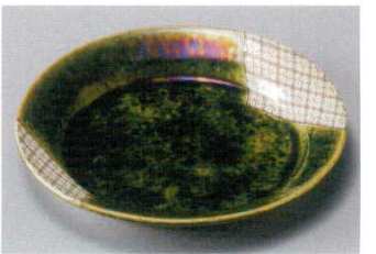
302-22-075 2,200円 織部菱紋6.0深皿 (19×2.5cm)