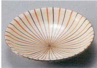
302-13-085 2,500円 麦わら十草6.0皿 (18×4cm) 手洗い