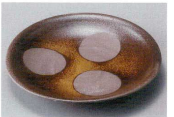
302-12-025 2,510円 手造焼締6.0丸皿 (18×3cm)