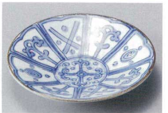
302-05-565 3,600円 染付花泉6.0皿 (18.3×4cm)