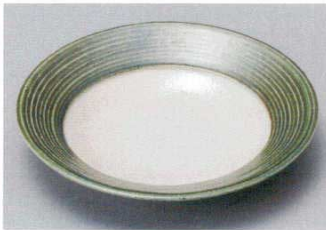
302-10-105 2,760円 織部千段盛皿 (20.5×3.3cm)