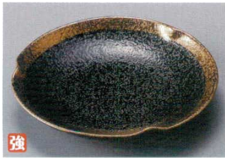
強 302-17-025 3,850円 黒ちらし測金巻6.0三つ押丸皿 (17.5×3.5cm) 302-18-025 2,510円 黒ちらし測金巻5.0三つ押丸皿 (14.5×3cm) 302-19-025 1,600円 黒ちらし測金巻3.5三つ押丸皿 (10.5×2.5cm)