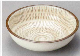
035-11-495 1,200円 飛び鉦玉湖6.5鉢 (20.6×6.5cm)