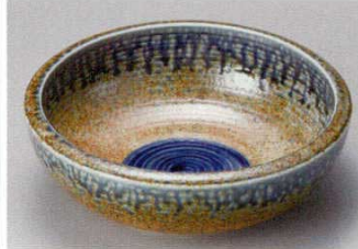
035-02-495 1,700円 藍流し青炎括り手8.0盛鉢 (24×8cm)