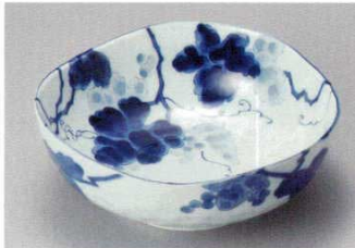
035-09-465 1,300円 藍染ぶどう6.8鉢 (20.5×20.3×7.5cm)