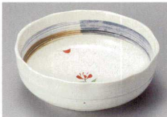
035-05-535 1,550円 二色ハケメ赤絵なごみ6.5鉢 (19.7×7cm)