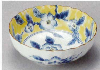
035-10-495 1,280円 黄彩花紋6.8鉢 (20.6×7.3cm)