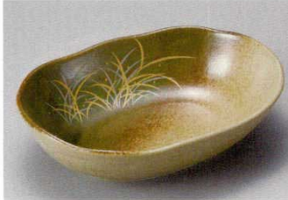
035-01-655 1,740円 金彩武蔵野盛鉢 (22×16.9×6.1cm)