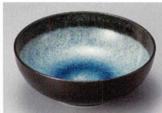
035-06-495 1,480円 有明ブルー7.0ボール (20.8×7.5cm)