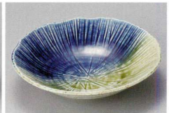
035-08-475 1,350円 二色流し大鉢 (24×22.5×5.5cm)