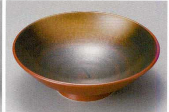
035-04-025 1,570円 美濃錦 8.0盛鉢 (24×8.5cm)