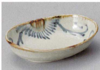
035-18-545 1,100円 安南唐草 21cm楕円盛鉢 (21×15.5×5.5cm)