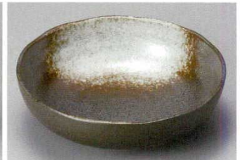
035-12-475 1,130円 白吹天目6.5ボール (19.7×5.6cm)