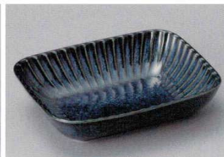
035-15-495 1,100円 窯変しのぎ長角深鉢 (19.3×15×4.7cm)