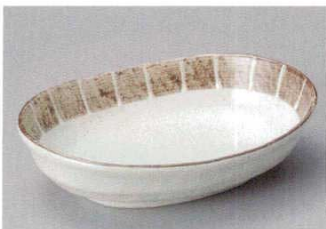
035-17-545 1,100円 粉引ライン 21cm楕円盛鉢 (21×15.5×5.5cm)