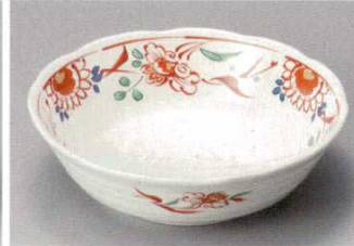
035-03-655 1,600円 万暦7.0鉢 (21.6×6.4cm)