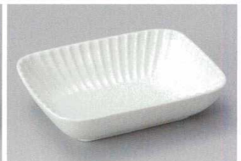
035-16-495 1,100円 白しのぎ長角深鉢 (19.3×15×4.7cm)