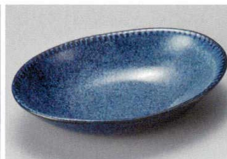
035-19-495 1,100円 窯変フリルカレー鉢 (23.7×17×5cm)