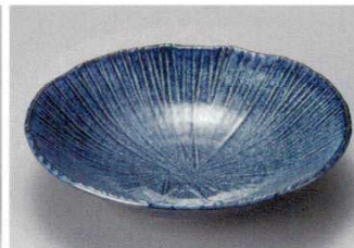
035-07-565 1,450円 花紺8.0盛鉢 (24×22.5×5.5cm)