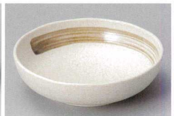
035-20-675 760円 織部刷毛砂茶6.5ボール (20×5.5cm)