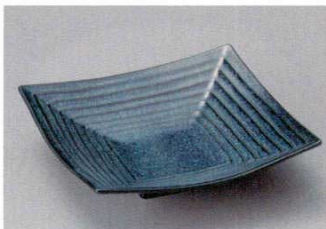
035-13-495 1,100円 窯変紺千段盛鉢 (19×19×5.5cm)