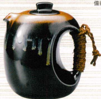
363-19-315 3,450円 天目縄巻ポット7号 (16×12×19cm・1400cc)1入