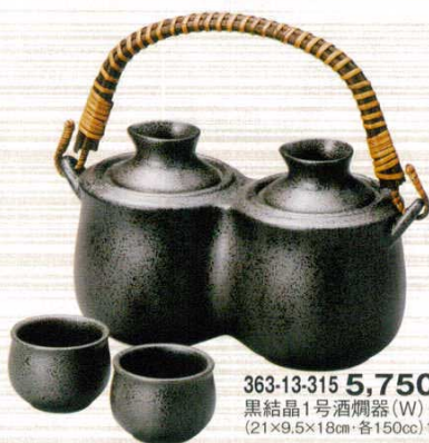
363-13-315 5,750円 黒結晶1号酒燗器(W) (盃2個付) (21×9.5×18cm・各150cc)1入