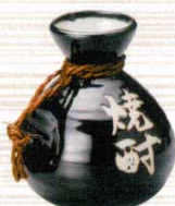
363-02-315 800円 焼耐1号金着德利 (8×9cm・220cc)10入