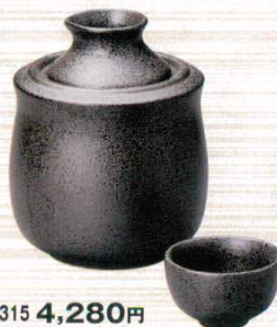
363-11-315 4,280円 黒結晶酒燗器セット(大) (300cc)