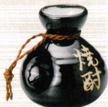
363-01-315 1,000円 焼耐2号金着德利 (10×11cm・360cc)10入