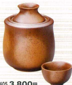
363-14-405 3,800円 備前吹酒燗器(大)德利付 (12×15cm・300cc)1入 363-15-405 480円 備前吹大丸グイ呑 (7×4.5cm)