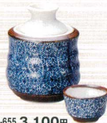
363-06-655 3,100円 細たこ唐草酒燗器 小 (10×12.6cm・140cc) 363-07-655 870円 細たこ唐草ぐい呑 中 (5.9×4cm)