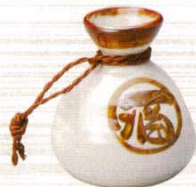
363-09-315 740円 丸酒金着型1号德利 (8×9cm・220cc)10入