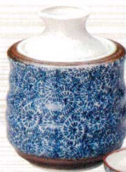
363-04-655 4,820円 細たこ唐草酒燗器 大 (11.6×15cm・300cc) 363-05-655 870円 細たこ唐草ぐい呑 大 (7×4.5cm)