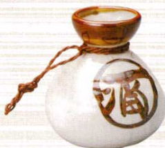
363-08-315 900円 丸酒金着形2号德利 (10×11cm・360cc)10入