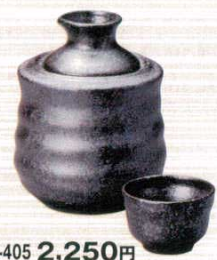
363-22-405 2,250円 銀黒酒燗器 小 (10×12.5cm・140cc)1入 363-23-405 500円 銀黒グイ呑 (5.8×3.8cm)