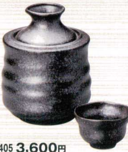
363-20-405 3,600円 銀黒酒燗器 大 (12.5×16cm・300cc)1入 363-21-405 530円 銀黒波洩グイ呑 (7×4.6cm)