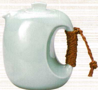
363-18-315 3,450円 青地縄巻ポット7号 (16×12×18cm・1400cc)1入