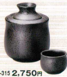
363-12-315 2,750円 黒結晶酒燗器セット(小) (150cc)