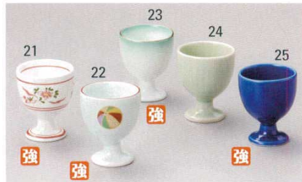
371-21-235 1,380円 赤絵花鳥すずらん型陶盃 (5×6.3cm・50cc) 371-22-235 1,200円 青磁夢風船陶盃 (5.2×6.3cm・50cc) 371-23-235 1,200円 洵風吹付ヒワ陶盃 (5×6.3cm・50cc) 371-24-235 900円 ビード口灰袖陶盃 (5.2×6.3cm・50cc) 371-25-235 900円 ルリ陶盃 (5×6.3cm・50cc)