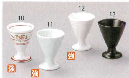
371-10-235 1,380円 赤絵花鳥朝顔型陶盃 (5×6.3cm・50cc) 371-11-235 1,100円 青白磁朝顔型陶盃 (5×6.3cm・50cc) 371-12-025 980円 白磁陶盃(あさがお型) (4.8×6.2cm・40cc) 371-13-025 980円 瀬戸黒陶盃(あさがお型) (4.8×6.2cm・40cc)