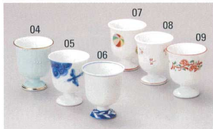
371-04-235 1,750円 青磁一珍渦金線食前酒 (5.8×7cm・80cc) 371-05-235 1,600円 つばめ食前酒 (5.6×6.8cm・60cc) 371-06-235 1,600円 月桂樹(紺)食前酒 (5.6×6.8cm・60cc) 371-07-235 1,500円 夢風船食前酒 (5.8×7cm・80cc) 371-08-235 1,500円 赤絵トンボ食前酒 (5.8×7cm・80cc) 371-09-235 1,500円 花万曆食前酒 (5.6×6.8cm・60cc)