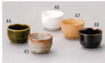
371-44-405 240円 民芸平丸オリベぐい呑 (5.6×4cm)36入 371-45-405 240円 民芸平丸嵐志ぐい呑 (5.6×4cm)36入 371-46-405 240円 民芸平丸白ぐい呑 (5.6×4cm)36入 371-47-405 240円 民芸平丸赤志ぐい呑 (5.6×4cm)36入 371-48-405 240円 民芸平丸天目ぐい呑 (5.6×4cm)36入