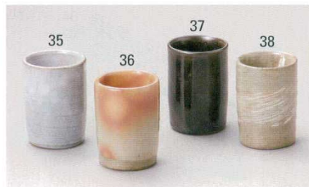
371-35-735 800円 青うのふ切立ぐい呑 (5.5×8cm・100cc) 371-36-735 800円 御本手切立ぐい呑 (5.5×8cm・100cc) 371-37-735 800円 天目切立ぐい呑 (5.5×8cm・100cc) 371-38-735 800円 還元ハケメ切立ぐい呑 (5.5×8cm・100cc)