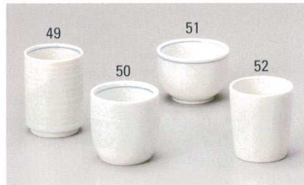
371-49-225 400円 白千段切立ぐい呑 (4×5.7cm) 371-50-225 360円 白千段タル型ぐい呑 (4.7×4.9cm) 371-51-225 320円 筋入反ぐい呑 (5.2×3.8cm・60cc)300入 371-52-225 270円 白切立コップ盃 (4.2×4.9cm・50cc)