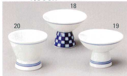
371-18-225 420円 市松丸高台盃 (5.6×6.9cm・30cc)500入 371-19-225 310円 筋入丸高台盃 (5.7×3.8cm・35cc)50入 371-20-225 320円 筋入平ぐい呑 (4.8×3.9cm・45cc)500入