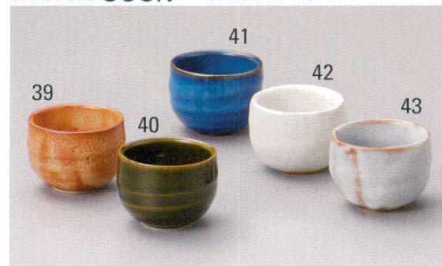
371-39-455 270円 赤志野丸形六兵ぐい呑 (6×4.5cm) 371-40-455 270円 織部丸形六兵ぐい呑 (6×4.5cm) 371-41-455 270円 ナマコ丸形六兵ぐい呑 (6×4.5cm) 371-42-455 270円 白志野丸形六兵ぐい呑 (6×4.5cm) 371-43-455 270円 鼠志野丸形六兵ぐい呑 (6×4.5cm)