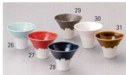
371-26-545 600円 ブルー富士山型グイ呑 (7.3×5.7cm) 371-27-545 600円 赤富士山型グイ呑 (7.3×5.7cm) 371-28-545 600円 ルリ富士山型グイ呑 (7.3×5.7cm) 371-29-545 600円 黒富士山型グイ呑 (7.3×5.7cm) 371-30-545 600円 ピンク富士山型グイ呑 (7.3×5.7cm) 371-31-545 600円 アメ富士山型グイ呑 (7.3×5.7cm)