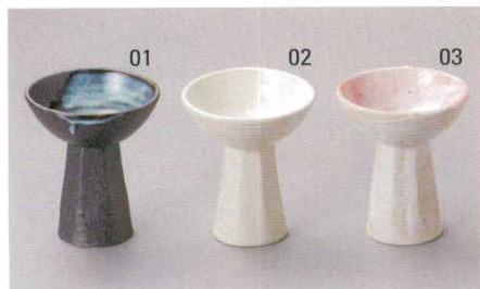
371-01-685 1,200円 青流天目馬上盃 (8.8×10.8cm・100cc) 371-02-685 1,190円 粉引馬上盃 (8.8×10.8cm・100cc) 371-03-685 1,190円 桜志野馬上盃 (8.8×10.8cm・100cc)