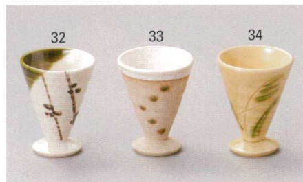
371-32-455 560円 オリベ梅高台盃 (5.6×7.2cm) 371-33-455 560円 粉引点紋高台盃 (5.6×7.2cm) 371-34-455 560円 黄瀬戸芦高台盃 (5.6×7.2cm)