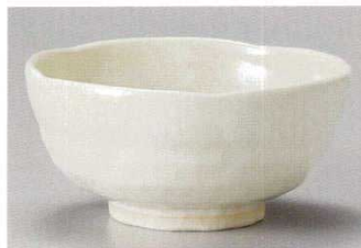
421-13-015 1,440円 乳白レトロ風丼 (15×7.3cm)