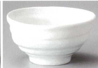
421-10-645 1,550円 白ろくろ目17.5cm丼 (17.5×9cm)