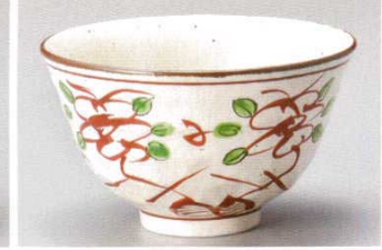
421-04-495 1,480円 手描き二輪椿5.0丼 (14.7×8.7cm)