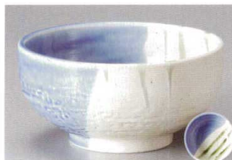
421-17-565 1,350円 清流白5.5釜上丼 (17.3×8.4cm)