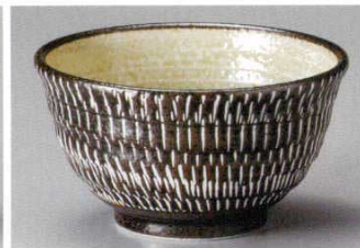
421-14-675 1,400円 どちり荒波砂目5.5反り丼 (16.2×8.9cm・970cc)