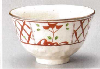
421-02-495 1,480円 手描き格子間取花5.0丼 (14.7×8.7cm)