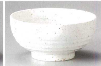
421-16-685 1,380円 白唐津6.3京丼 (19×9.4cm)