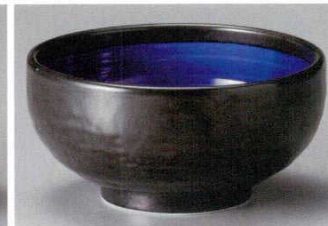
421-15-515 1,380円 南蛮ブルー石目5.5高浜丼 (16.9×8.2cm)