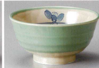
421-11-645 1,480円 ヒスイ梅便り多用丼 (17×9cm)