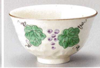
421-03-495 1,480円 手描きぶどう5.0丼 (14.7×8.7cm)