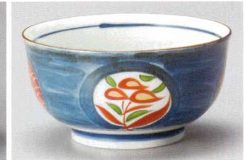
421-08-515 1,350円 錦丸紋5.0丼 (15.3×8cm)