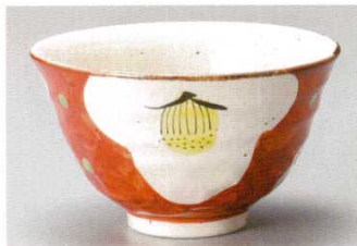
421-05-495 1,480円 手描き赤ダミ椿5.0丼 (14.7×8.7cm)