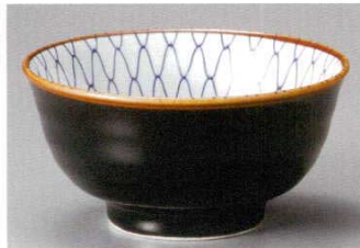
421-09-645 1,580円 天目網多用丼 (17×9cm)