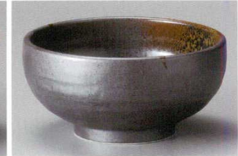
421-12-515 1,480円 南蛮吹流し5.5高浜丼 (17×8.5cm)