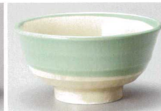
421-20-515 1,420円 ヒスイ5.5深口丼 (16.8×8.6cm) 421-21-515 1,150円 ヒスイ5.0深口丼 (15.7×8cm)