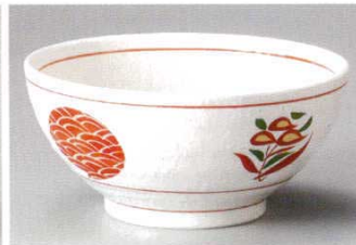
421-06-495 1,580円 粉引釉丸紋さぬき丼 (18.8×9cm)