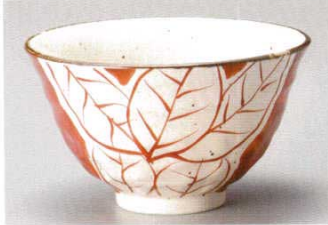
421-01-495 1,480円 手描き赤ダミ木の葉5.0丼 (14.7×8.7cm)