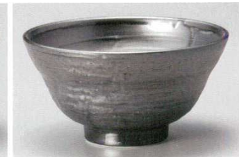
421-22-545 1,600円 刷毛巻銀彩5.0お好み丼 (16×8.4cm) 421-23-545 1,200円 刷毛巻銀彩4.5お好み丼 (13×7.8cm)