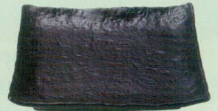
546-34-685 3,400円 黒マット9.0正角皿 (27×4.5cm)