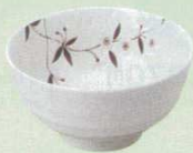
570-02-435 820円 5.5多用井 (16.8×8.8cm)