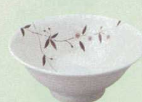
570-17-435 750円 6.5そば井 (19.5×8cm)