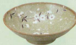
570-65-435 1,500円 8.0盛鉢 (24.5×8cm)