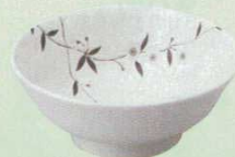
570-16-435 1,250円 6.8高台ラーメン井 (21×8.5cm)