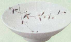
570-15-435 1,500円 8.0盛鉢 (24.5×8cm)