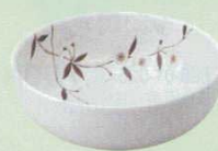
570-05-435 1,200円 6.5ボール (19.7×7.2cm)