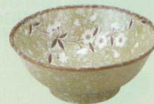
570-66-435 1,250円 6.8高台ラーメン井 (21×8.5cm)