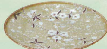
570-61-435 1,300円 8.0皿 (25.6×3.4cm)