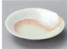
059-24-505 2,450円 オレンジ吹ラスター勾玉平鉢(中) (16.7×16×4cm)