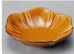
059-13-475 2,550円 あめ釉六つ山花形向付 (16.5×16×4.5cm)