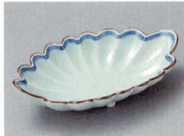
059-11-545 2,600円 瀨ゴス菊型楕円向付 (23.3×14×5.4cm)