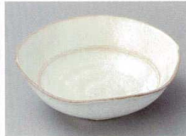
059-12-105 2,700円 粉引五角お手盛り鉢 (18×17×6cm)