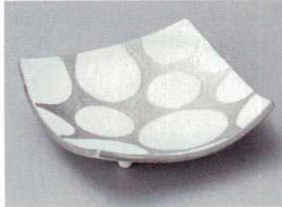
059-01-495 2,680円 銀彩水玉四方上り皿 (15.8×15.8×4.5cm)