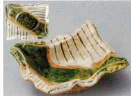
059-09-525 2,600円 織部細十草6.0長角向付 (17.5×14.5×6.5cm)