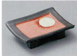
059-21-475 2,480円 黒土萬月長角高台皿向付 (15.8×11.5×4.2cm)