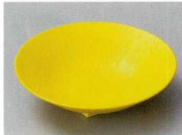
059-06-025 2,640円 黄とちり(6.0寸深)丸皿 (17×4.5cm)