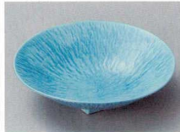
059-07-025 2,640円 水色とちり(6.0寸深)丸皿 (17×4.5cm)