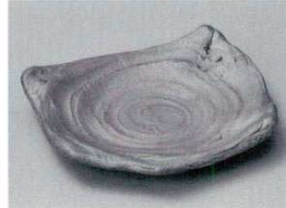
059-19-505 2,500円 炭化いぶし手びねり皿(中) (19×18×3cm)