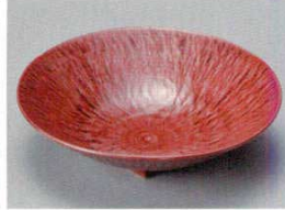
059-05-025 2,640円 とちり(紫)向付 (17×4.6cm)