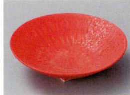
059-28-475 2,350円 朱釉向付 (17.2×4.8cm)