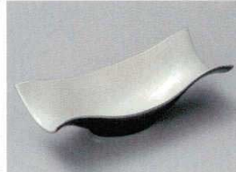
059-17-545 2,500円 アメ釉シルバースしぼり7.0向付 (21.5×9×5.8cm)