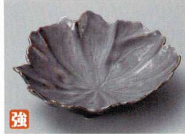
059-02-545 2,650円 金結晶木の葉向付 (17.5×16.5×5.7cm)