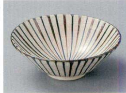
059-25-085 2,400円 ゴス十草5.0平鉢 (15×5.5cm) 手洗い