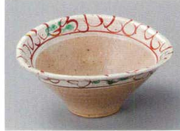
059-04-545 2,650円 赤絵瀨唐草両口鉢 (16.8×14.4×6.8cm)