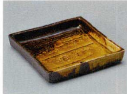
059-26-475 2,400円 あめ釉掛分け砂目正角5.0皿 (16×16×3cm)