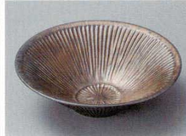
059-18-475 2,500円 金結晶しのぎ彫6.3鉢 (19×5.5cm)