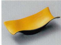
059-16-545 2,500円 アメ釉ゴールドしぼり7.0向付 (21.5×9×5.8cm)