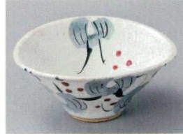
059-29-545 2,200円 山帰来黒両口鉢 (16.8×14.4×6.8cm)