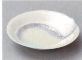
059-22-505 2,450円 パープル吹ラスター勾玉平鉢(中) (16.7×16×4cm)