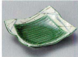
059-10-475 2,600円 織部筋彫り長角向付 (19×16.5×5cm)