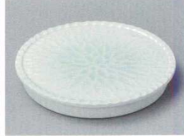
059-30-475 2,200円 青白磁花彫17.5cm皿 (17.3×2cm)