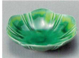
059-14-475 2,550円 緑釉黄流し六つ山花型向付 (17×16×7.4cm)