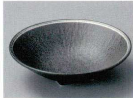
059-08-475 2,600円 黒結晶プラチナとちり丸皿 (17.2×4.7cm)