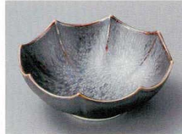
059-27-475 2,350円 孔雀八角鉢 (15.2×5.3cm)