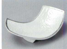
059-20-475 2,500円 瀨プラチナ向付 (20×10.5×4.2cm)