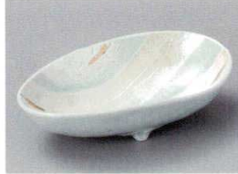
059-03-475 2,650円 青磁流水ラスター三足小鉢 (17×11×4.5cm)