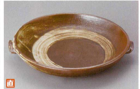
直 597-12-735 4,800円 サビ刷毛9号深陶板 (31×29×5cm)