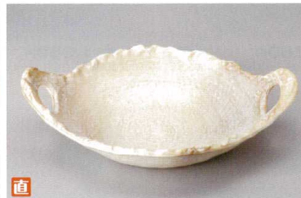
直 597-15-735 3,500円 三鈴志野8号変形陶板 (32×26×5cm) 597-16-735 2,100円 三鈴志野6号変形陶板 (24.5×19×5cm)