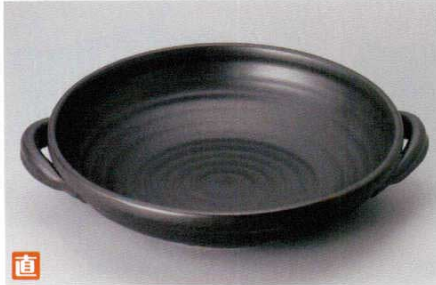
直 597-01-715 7,000円 バエリアパン黒手付10号 (33.5×30×7.3cm) 597-02-715 4,200円 バエリアパン黒手付8号 (28×24.5×6.3cm)