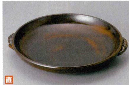
直 597-09-715 4,300円 灰釉陶板10号 (33.5×30.5×5cm) 597-10-715 3,000円 灰釉陶板8号 (28.5×25.8×4.3cm) 597-11-715 2,300円 灰釉陶板7号 (25.3×22.7×3.6cm)