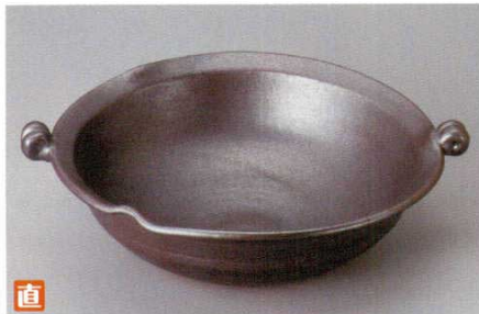
直 597-07-715 4,700円 鉄結晶(手造り)耐熱ボール(大) (25.5×7cm) 597-08-715 3,450円 鉄結晶(手造り)耐熱ボール(小) (21.5×6cm)