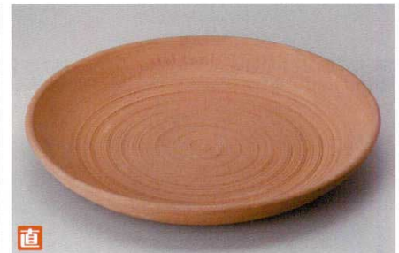
直 597-17-715 4,700円 ホーロク10号 (30×3cm) 597-18-715 2,900円 ホーロク8号 (24×3cm)