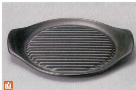
直 597-19-645 3,300円 黒26cmステーキ皿 (26×22.9×3.3cm)