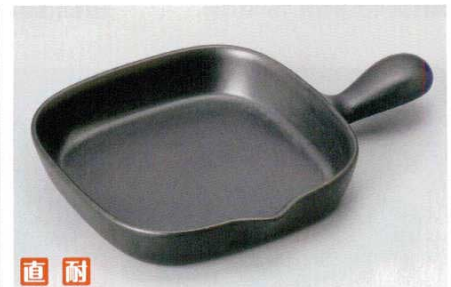
直耐 597-21-725 2,600円 黒無地耐熱グリルパン (27.5×19×4cm)