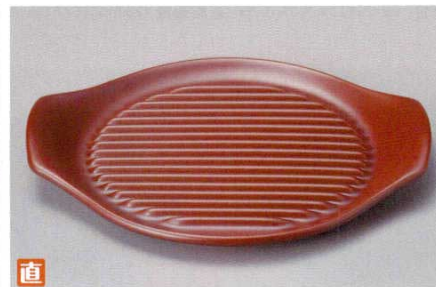
直 597-20-645 3,300円 鉄赤26cmステーキ皿 (26×22.9×3.3cm)