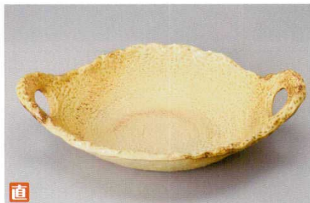
直 597-13-735 3,500円 イラホ8号変形陶板 (32×26×6cm) 597-14-735 2,100円 イラホ6号変形陶板 (24.5×19.5×5cm)