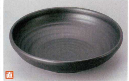
直 597-05-715 6,000円 バエリアパン黒手なし10号 (30×7.3cm) 597-06-715 3,500円 バエリアパン黒手なし8号 (24.5×6.3cm)