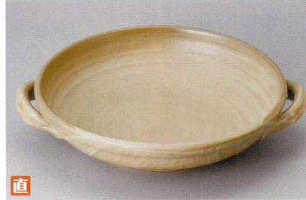
直 597-03-715 7,000円 バエリアパン茶手付10号 (33.5×30×7.3cm) 597-04-715 4,200円 バエリアパン茶手付8号 (28×24.5×6.3cm)