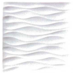
621-07-645 2,850円 水面23cmスクエアプレート (23.5×23.5×2.5cm)