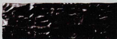
621-11-405 2,750円 黒マット炭型細長角皿 (31.3×10×1cm)