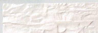
621-10-405 2,750円 NB炭型細長角皿 (31.1×10×1cm)