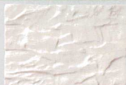
621-09-405 1,700円 NB炭型長角皿小 (19×12.7×1cm)