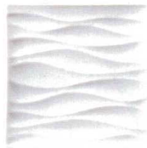
621-06-645 1,540円 水面17cmスクエアプレート (17×17×1.8cm)