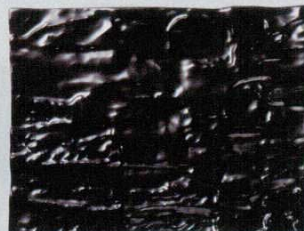
621-13-405 3,080円 黒マット炭型長角皿大 (24.5×18.4×1cm)