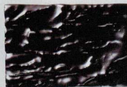
621-12-405 1,980円 黒マット炭型長角皿小 (19×12.7×1cm)