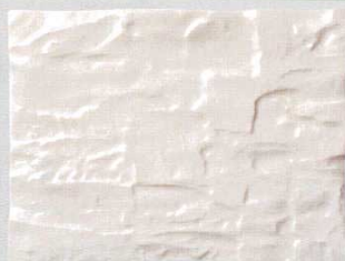
621-08-405 3,080円 NB炭型長角皿大 (24.5×18.4×1cm)